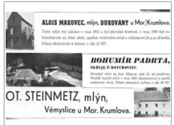
Výřez z dobového inzerátu, kde je také uveden Steinmetzův mlýn

Tato úprava vydržela až do roku 1845, kdy jarní voda s ledy část náplát strhla. Opět nastalo dohadování mlynáře s vrchností. Vrchnost sice dodala potřebné dřevo na