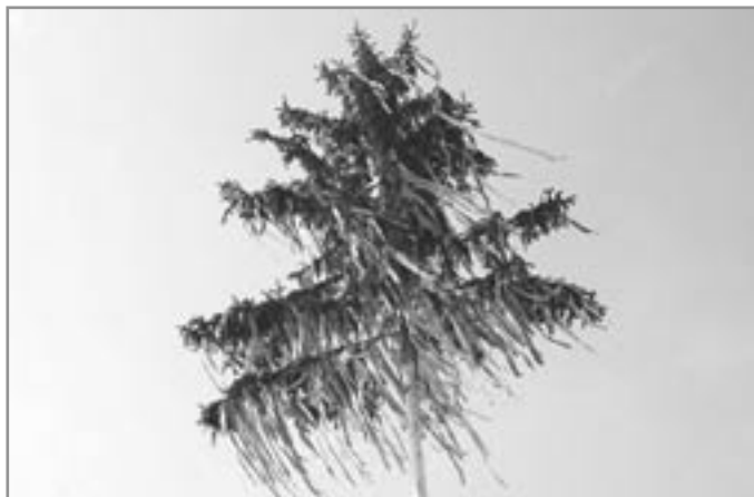
Z daleka viditelná máje byla znamením pořádání hodů

Tradici se starými kořeny byla i vzpomínka na zemřelé. V pondělí ráno se konala zádušní mše za zemřelé osadníky. Po ní se chodilo v průvodu na hřbitov, lidé se modlili u kříže a navštívili hroby zemřelých. Novodobou formou se stalo položení věnců k památníkům padlých v první a druhé světové válce.