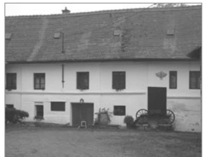
Vémyslice, mlýn Steinmetzův, září 2010