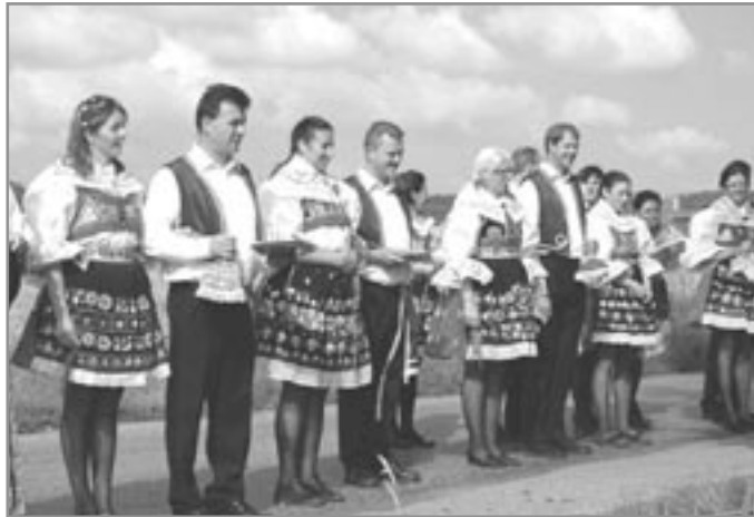
Před pomníkem padlých v Hrubšicích

Hody - posvícení se slavily téměř v každé farnosti v jinou dobu. Lidé chodili na posvícení konané v okolních obcích nejen, aby navštívili příbuzné a známé, ale také proto, že se jim díky těmto slavnostem naskývala možnost dobrého jídla a zároveň odpočinku od práce. To vše byla ta lepší stránka hodů, ale trpěla tím pracovní morálka, protože četnost hodů a nesmírné hodování odvádělo poddané od práce.