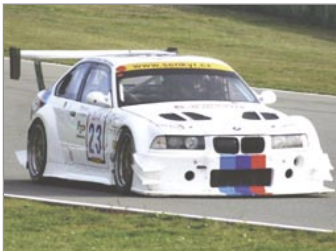
BMW týmu Šenkýř Motorsport na okruhu