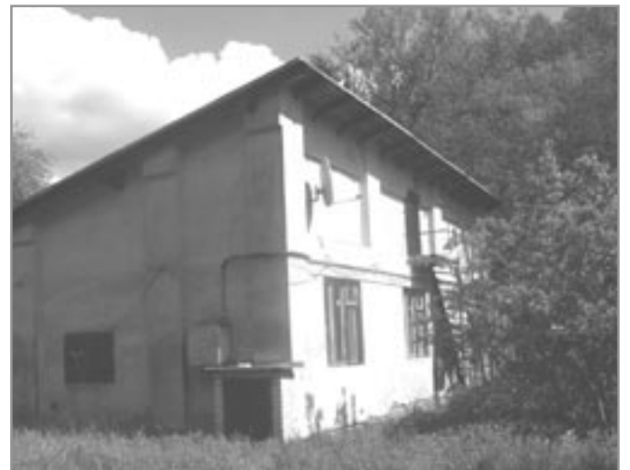
Čerpací stanice - od Neslovického potoka, květen 2012

Po dvanácti letech působení v revíru Innerberská společnost zakoupené doly prodala. Její záměr, pro který doly koupila, tedy vyrábět zde kvalitní koks, se nenaplnil. Předpokládala, že koks vyrobený ze zdejšího uhlí bude sloužit pro její právě budované rozsáhlé železárně ve Schwechatu u Vídně. K tomuto účelu také dobuďovala v roce 1873 z dolu Simson na důl Anna železniční vlečku. Měla tak připravené ideální podmínky pro zamýšlenou přepravu koksu do Vídně. Avšak koks vyrobený z vytěženého zdejšího uhlí byl sice výborný, ale pro metalurgické účely se nehodil, proto společnost doly pro-