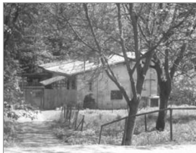
Budova čerpací stanice byla postavena před 140 lety

stru tvořil malý potůček, tekoucí ze západní strany od Zbýšova, ve směru od bývalého dolu Barbora. Protékal pod silnicí a směrem východním pokračoval přímo k Neslovickému potoku, kam se vléval. Čerpací stanice stála těsně nad tímto potůčkem, tedy v katastru obce Zbýšov, pod potůčkem již byl katastr obce Padochov. Samotu nazvali „Mašinka“ a budova nesla číslo popisné 76. Byl zde i byt pro obsluhu čerpadel.