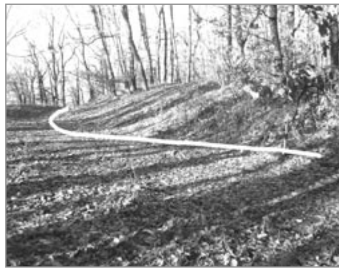
Pozůstatky valu a příkopu chránících předhradí