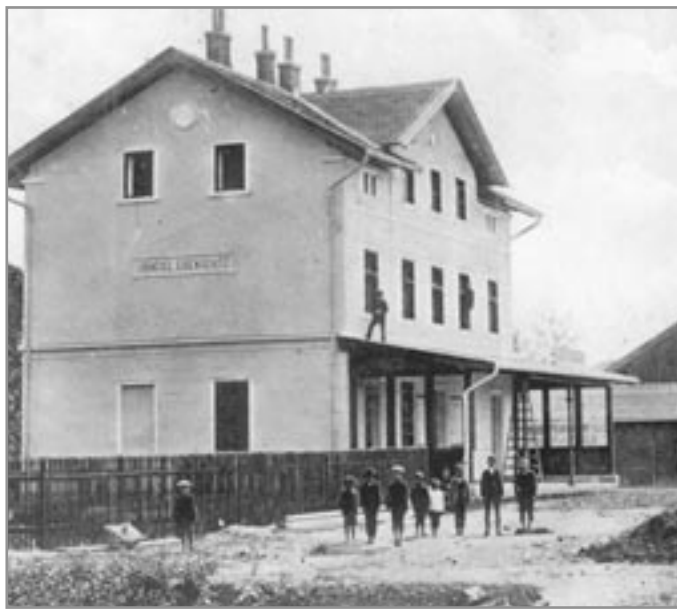
Nádraží v Ivančicích v roce 1912

V Zrcadle č. 13/2007 byla popsána historie železniční dráhy Moravské Bránice – Ivančice – Oslavany. V době stavby a po cca 30 let provozu byla známá pod zkratkou KIOD – Kounicko-Ivančicko-Oslavanská dráha. Dnes uvedeme pouze základní údaje, abychom připomněli, že 14. července tomu bude již 100 let od zprovoznění této dráhy.