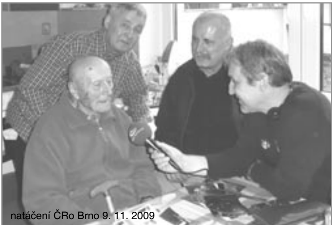
natáčení ČRo Brno 9. 11. 2009