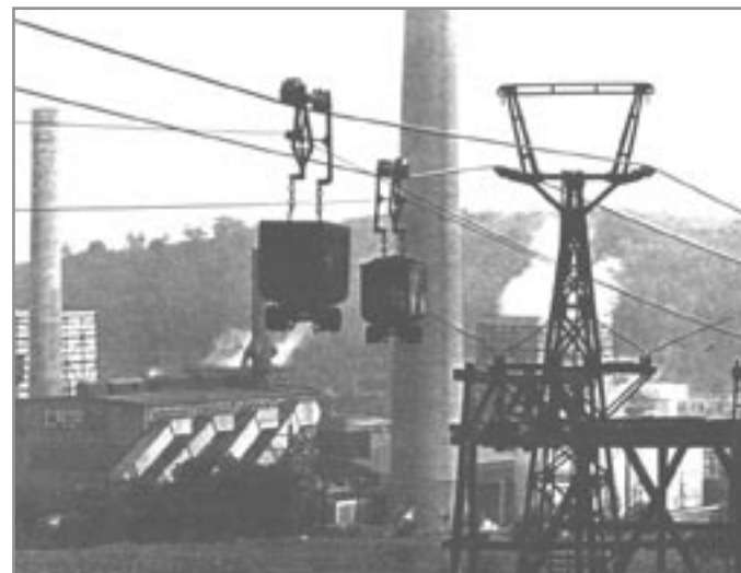
Uhlí a elektrina - symbolika Rosicko-Oslavanska do roku 1992.

Použité prameny: Plchová, J.: Rosicko-oslavanský uhelný revír. Město Oslavany, 1999 • Plchová, J.: Rosicko-oslavanská černouhelná pánev v datech. Oslavany, 2002 • Plchová, J.: Zbýšov, kapitoly z minulosti a těžba uhlí. Město Zbýšov, 2008