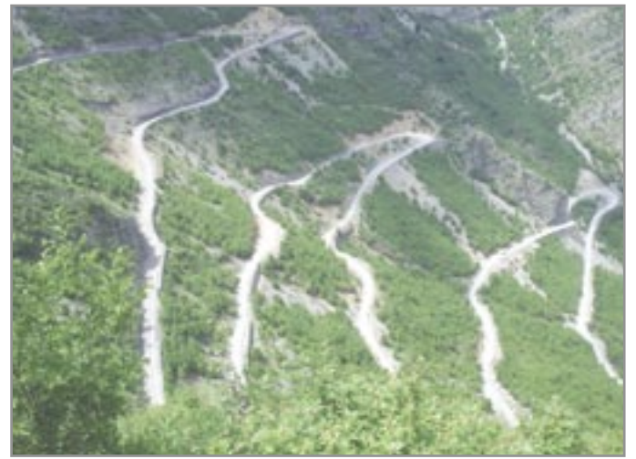
Albánské horské cesty

V domnění, že dál nás čeká lepší cesta, směřujeme na Skadar (Škodra). Komunikace je místy široká asi 15 metrů a připadá si jak na vyprahlé motokrosové trati. Všude moře prachu a samá