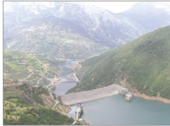
Vodní soustava na řece Drině