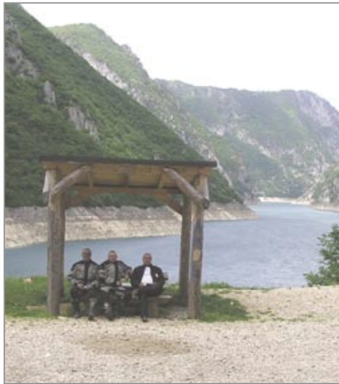
Odpočinek u jezera Pivsko - Černá Hora

Motorkářský ráj pokračuje dál. Jedna zatáčka za druhou s téměř žádným provozem. Průjezdem přes Andrejevicu se dostáváme k Plavskému jezeru. Tankujeme plnou nádrž, nevíme, co nás čeká v blízkosti se Albánií. Těsně před hranicí uhybáme a směřujeme k prohlídce řeky, vyvěrající ze země, s názvem Oko Skakavice. Při příjezdu k této turistické zajímavosti absolvujeme první off-road vložku a brod. No prostě paráda. Kluci mi trochu vyčínili, kam je to tahám, ale na druhou