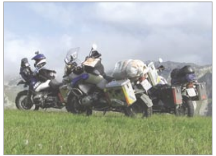
V národním parku Durmitor - Černá Hora