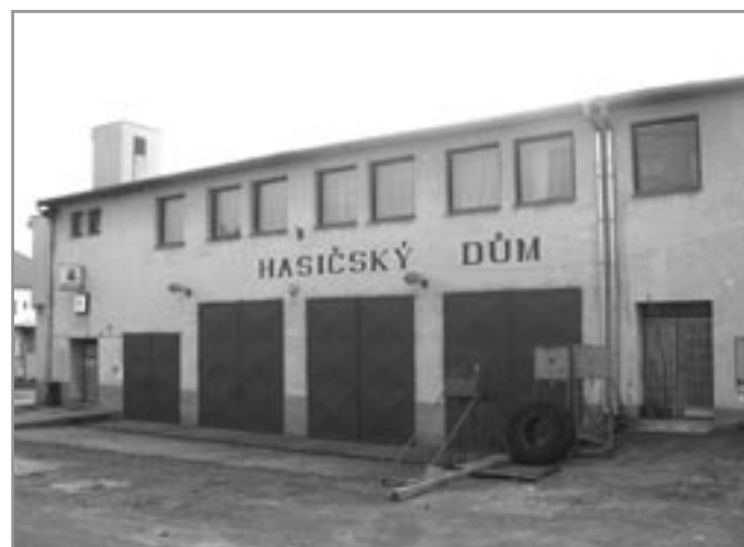
Hasičská stanice Sboru dobrovolných hasičů v Miroslavi

Sbor dobrovolných hasičů v Miroslavi byl založen 24. ledna 1880, počet členů při založení byl 28, o padesát let později 65. Zpočátku měl sbor jednu stříkačku, dva vozy na vodu, jeden mechanický posuvný žebřík a dvě skladiště. Na dnešní poměry velice skromné vybavení.