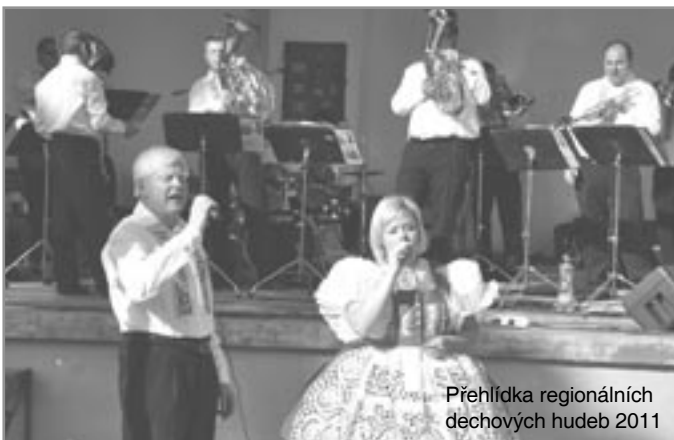
Přebídku regionálních dechových hudeb 2011

Říká se, že s jídlem roste chuť. To se projevuje i v činnosti spolku, který s každým úspěšně zvládnutým počinem přemýšlí, jak a čím život ve městě dále obohatit. Loni tak měla premiéru Přebídku regionálních dechových hudeb, která našemu městu jako druhému největšímu městu Znojemska citelně chyběla, letos úspěšně proběhl 2. ročník. Další, ale nikoliv poslední větší akci, organizovanou spolkem, je Burčákováni, jehož 2. běh, tentokrát v Rakšicích, ve finanční režii Staré hospody, máme šťastně za sebou. Zdá se, že se již zapalo, stejně jako dechovky a slavnosti s májalesem, do pomyslného kalendáře společenství. Vždyť 700 litrů burčáku, dvě prasata, hektolitry piva, desítky litrů vína a spousta trdelníků, starodávných plátek a dalších dobrot, to vše za doprovodu šesti hudebních skupin od dechovky přes legendární ARCUS, navazujících od rána do večera, zmizelo v hrdlech spokojených návštěvníků.