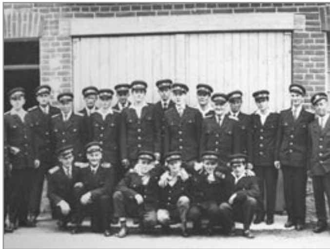
Hasičský sbor před původní hasičskou zbrojnicí.