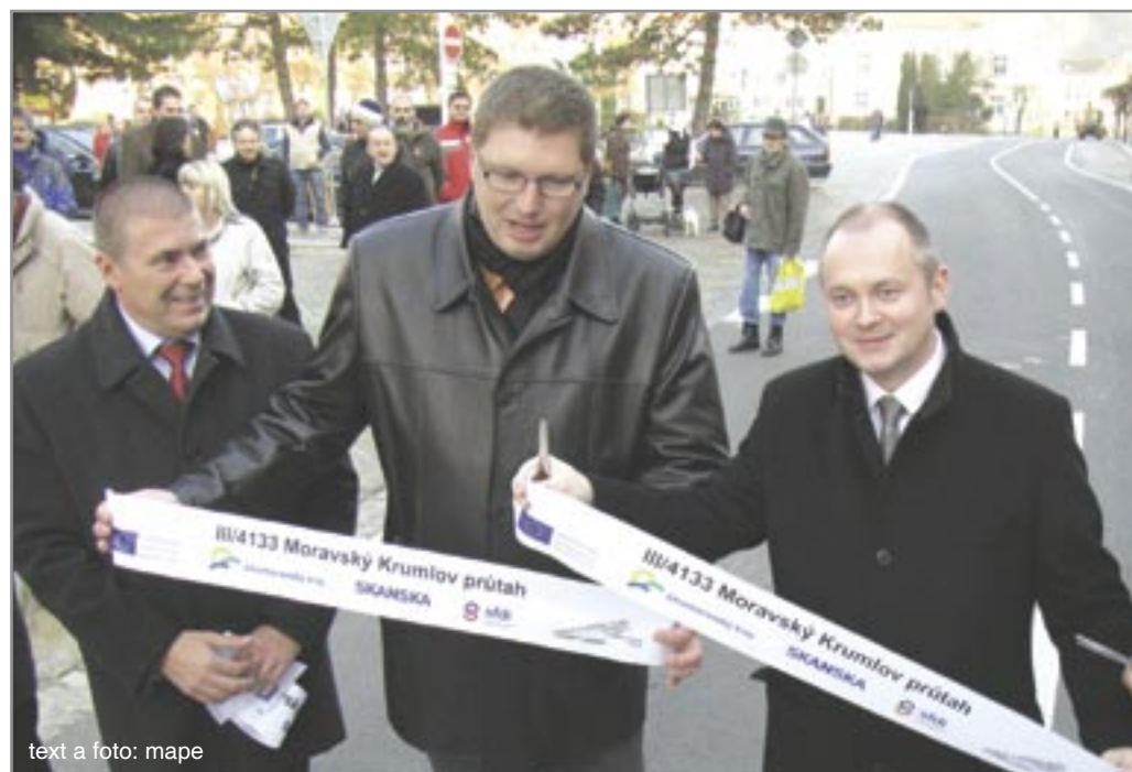
text a foto: mape

„Vzhledem k nevyhovujícím zkušenkám na části třetí etapy (od budovy KB pod garáže pod budovou gymnázia) se celoplošně