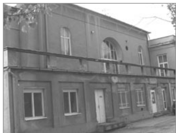
Část bývalé synagogy, dnes Kulturní dům