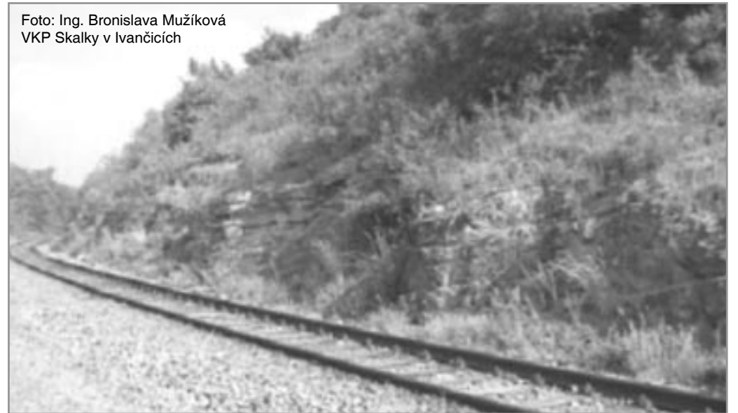
VKP Skalky v Ivančicích

V odborné publikaci, která mapovala VKP v okrese Brno-venkov, se můžeme dočíst, že se jedná o skalnatou lesostep se skalními výchozy, které jsou nanejvýš cenné. Bohužel od vyhlášení za VKP se lokalita proměnila k nepoznání. Téměř celý svah je zarostlý akátem, trnkou obecnou, ptačím zobem a dalšími dřevinami. Najdeme zde černé skládky i bývalé „bunkry“ dětí.