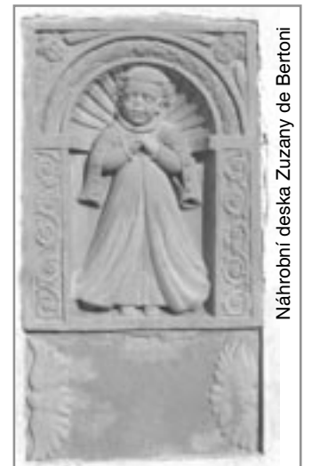
Náhrobní deska Zuzany de Bartoní