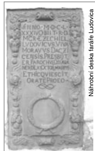
Náhrobní deska faráře Ludovica

Z druhé strany věže, na severním průčelí, se znovu připomíná