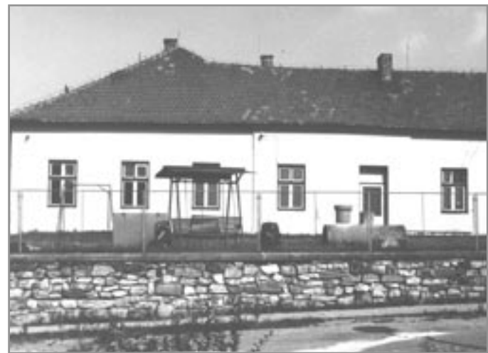
Původní školní budova z roku 1874 po opravách

Provoz školy se postupně zlepšil, ale velice nepříznivě se projevil důsledek 1. sv. války. Od roku 1920 se projevoval ve škole nedostatek učeben. Snahy o přístavbu nebo i nadstavbu školy byly zamítnuty. V roce 1930 bylo rozhodnuto o stavbě nové školy, ale až v září 1933 se začalo stavět. Obec, která pronajímala