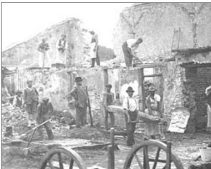
Stará sokolovna před přestavbou v roce 1930, Palackého ulice