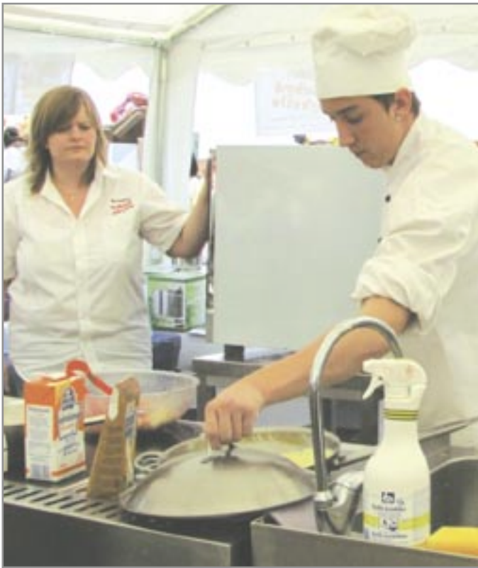
Přes tisíc porcí pochoutek z chřestu připravila restaurace Dobrá chvíle.

Ochutnávka Moravy na 17. slavnostech chřestu je už za námi. Letos se udělal krok k tomu, aby měli návštěvníci chuť přijet na Moravu nejen na vinobraní v době burčáků, zelených vinogradů a všude přítomné vůně lisovaného vína, ale aby viděli i jarní stráně kvetoucích akátů, zelených meruňků a hlavně vůni všude vařeného chřestu ve všech podobách. A to se rozhodně vydařilo.