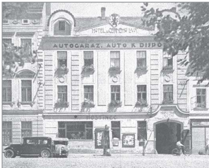
Hotel U Černého lva před 2. sv. válkou na dobové fotografii

„Dopady dětského odpadu“ společnosti Rosa, o. p. s.