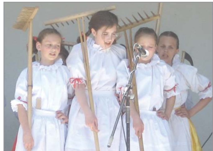
Z vystoupení souboru Rouchováček

Nápadem „z nouze“, který se ukázal jako skvělý, bylo letos umístění Majálesu i slavností do areálu Vrabčí hájek, protože město je celé stavebně rozkopáno. Tato změna však neměla vliv na účast. To je důkaz že akce si již získala pozornost studentů