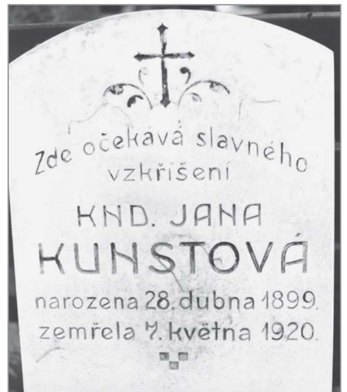
Deska z hrobu milosrdné sestry - hřbitov v Ivančicích.

POUŽITÉ PRAMENY: • Farní kronika, uložená na faře v Ivančicích • Pamětní kniha města Ivančic - SOKA Rajhrad, fond C 36 - 197 a 198 • Zápisy rady NV v Ivančicích - SOKA Rajhrad • Ivančický zpravodaj č. 5/2004