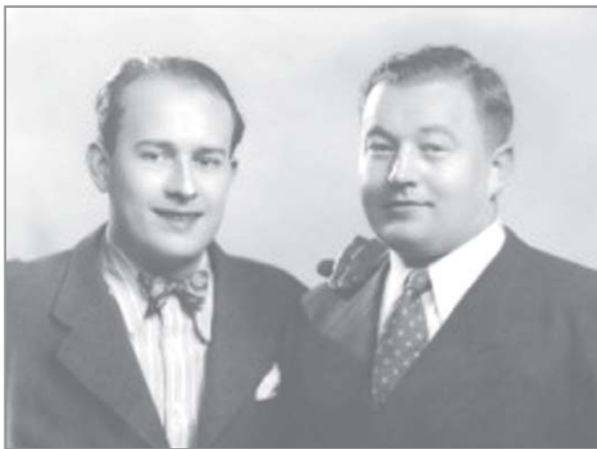
Jiří Voskovec a Jan Werich

Najednou tam přijde člověk a říká: „Chcete vyvěsit bílej prapor na věznici?“ My říkáme s Voskovcem: „To musíme vyvěsit, to