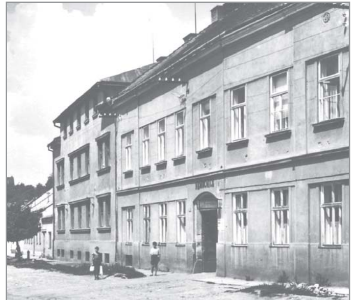
Budova nemocnice. Vlevo je část postavená pro ubytování milosrdných sester a personálu.

Po odvolání milosrdných sester z ivančické nemocnice v roce 1956 byly poslány do nového působiště v Mirošově (u Rokycan). V bývalých vojenských dřevěných barácích (za války to bylo pobočka koncentračního tábora v Koučovicích kolejích v Brně a po válce internační tábor pro německé občany) bylo v té době kolem 350 nemocných, z toho asi