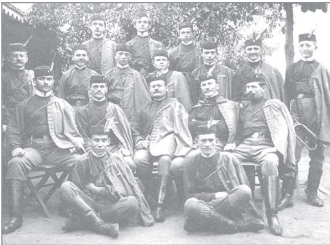
Jednota Sokol Moravský Krumlov archiv Jednoty, nedatováno

Po roce 1945 se rychle navázalo na prvorepublikovou tradici, rychle rostla členská základna. Na XI. sletu na podzim 1948 na pražském Strahově vystoupilo přes půl milionu cvičenců. Došlo zde k demonstracím proti novému režimu, akční výbory poté provedly čistky nepohodlných členů. Po únorovém puči bylo dosaženo faktického sloučení tělovýchovy. Zprvu sice dál fungovaly jednoty pod názvem Sokol, ale původní orgány Československé obce sokolské již neexistovaly. V roce 1952 byl přijat zákon o tělesné výchově a sportu, který sjednotil řízení a kontrolu celé tělovýchovy pod dohled KSČ.