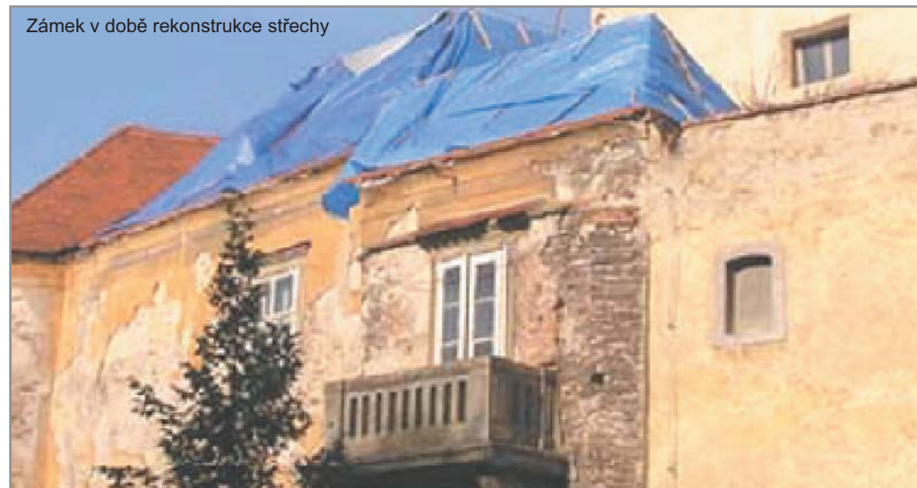
Zámek v době rekonstrukce střechy