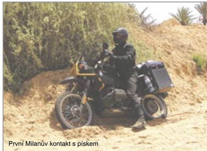
První Milanův kontakt s písekem

ke skutečnosti, že je staršího data výroby a jeho páteř patří k nepevnějším, by toto skončilo při nejmenším pádem a pohmožděním krku. Měl jsem štěstí, děkuji za něj, ale nevím komu. Najeto 300 km. Celkem 3074 km.