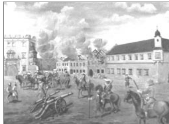
Švédové v Ivančicích - fotografie obrazu Hynka Raimana

Dne 10. května 1628 začalo platit pro Moravu „Obnovené zřízení zemské“. Prakticky se jednalo o zemskou ústavu vydanou panovníkem. V nejdůležitějších bodech uzákonila tato ústava absolutismus, určovala dědičnost českého trůnu v habsburském rodě a povolovala pouze katolické náboženství. Do češtiny přeložil uvedenou