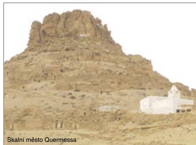
Skalní město Quermessa