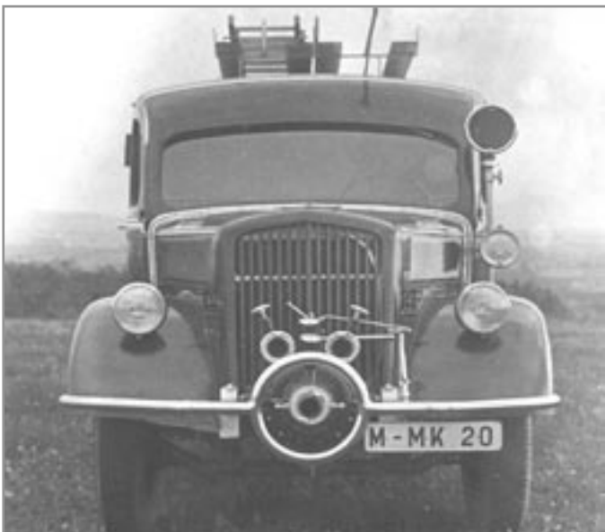
Hasičské auto krumlovského hasičského sboru

Předchůdcem prvních dobrovolných hasičských sborů byly sbory placené, jako první se připomíná v roce 1854 založený sbor v Zákupcech. Stejně jako v Čechách byly na Moravě nejstarší dobrovolné sbory německé. Pokusy o založení českých sborů byly neúspěšně podniknuty v 60. letech 19. století. První český sbor byl založen v roce 1871 ve Velkém Meziříčí. Hasičské sbory se z absence jednotného vedení začaly sdružovat do okresních a župních jednot. Organizace podporovaly rodiny zraněných hasičů. Jednoty se brzy národnostně vyhraňují, a tak vznikají v roce 1879 „ Feuerwehr-Landes-Central-Verband für Böhmen “ a v roce 1883 „ České ústřední jednoty hasičské moravskoslezských dobrovolných sborů hasičských “. V roce 1882 byl vydán zákon, na základě kterého pojišťovny přispívaly na hasičské účely, což vedlo k dalšímu rozvoji hasičských sborů. V pozdějších letech bylo vydáno nařízení, aby každá obec s 50 obytnými domy měla vlastní dobrovolný hasičský sbor.