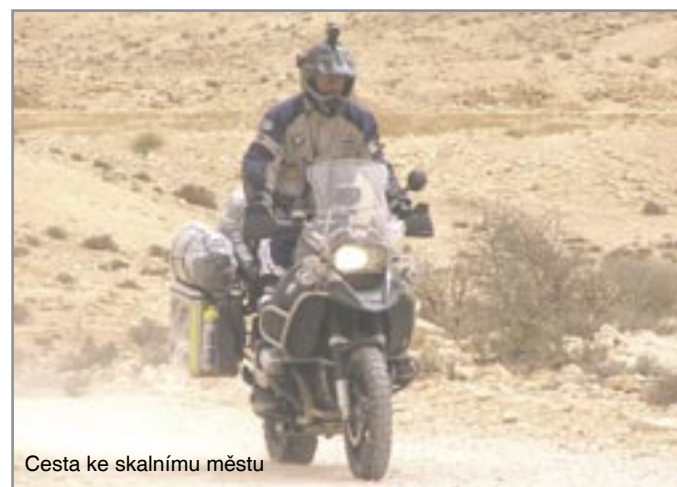
Cesta ke skalnímu městu

Za tu krátkou dobu, co jsme v Tunisku, vyzozorujeme, že hromadná doprava zde stojí na