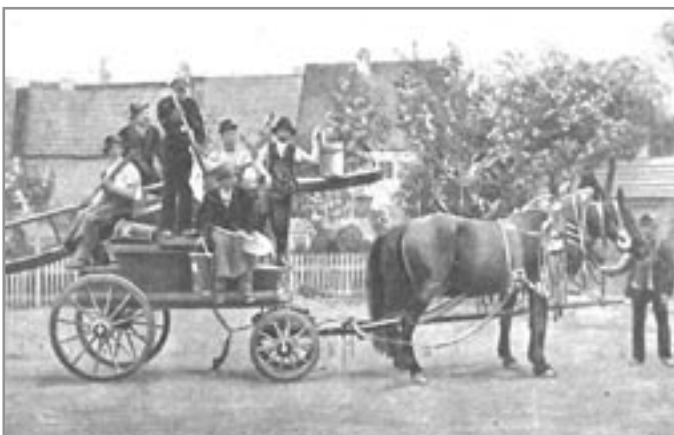
Ukázka hašení v 19. stol. z knihy: Krška, Titus: Hasičská kronika, 1898.

Městský krumlovský sbor se k župě z národnostních důvodů nehlásil až do roku 1918. Sjezd župy v Moravském Krumlově se konal až v roce 1922 u příležitosti 40. výročí místního sboru dobrovolných hasičů. Činnost Jednoty byla přerušena v roce 1940. Pokračování příště. Mgr. Hana Prymusová