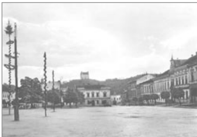
Náměstí - východní strana před r. 1945.