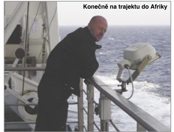
Konečně na trajektu do Afriky