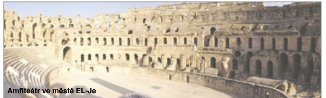
Amfiteátr ve městě EL-Je