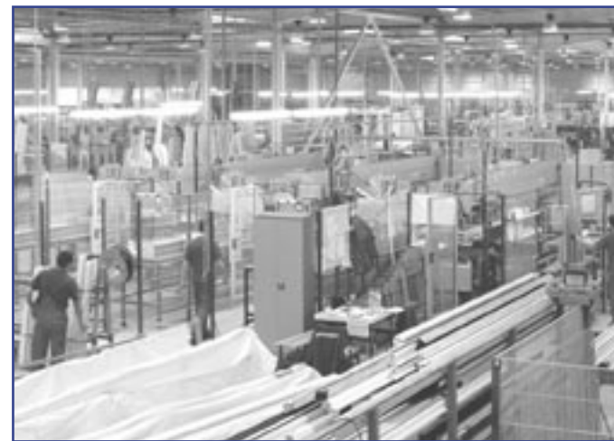
Nová výrobní hala - výroba plastových oken a dveří

• Naučili jsme se naslouchat potřebám našich klientů a pochopili jsme, že každý je důležitý.