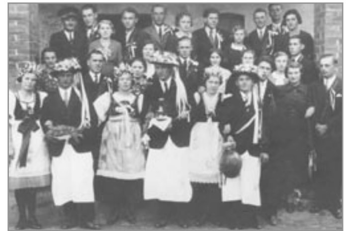
Hody v roce 1935. Poznáte někoho?

Rychlostí blesku věděla celá dědina, že už jedou. Máj byla přivezena na plac, položena na prázdné