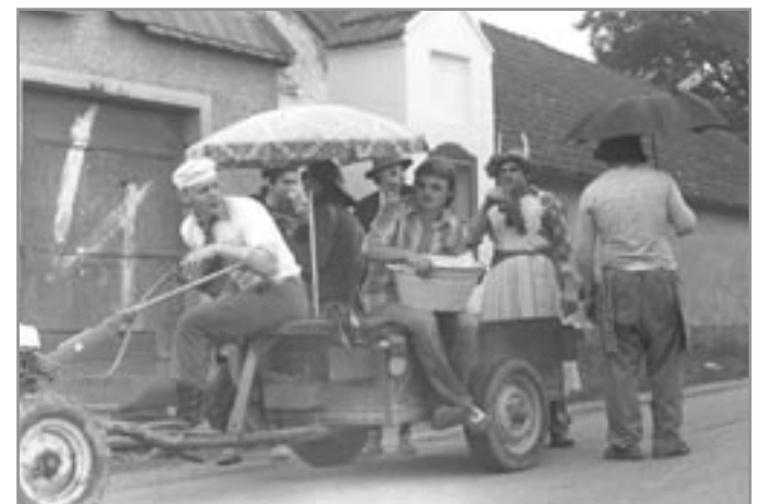
Dnes se již vesnice neobchází. Máme přece dopravní prostředky.

POUŽITÉ PRAMENY: Ivančické zpravodaje č. 10/1995 a 10/2003,