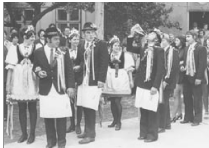
Hody před 36 lety

Jádrum hodů je křesťanská slavnost na počest zasvěcení chrámu, jak se o ní zmiňuje svatozáclavská pověst z 10. století. Ta navázala na dávnou rodovou slavnost spjatou s uctíváním předků, obětí a hodováním po sklizni. Tradicí se starými kořeny je tedy vzpomínka na zemřelé. V pondělí ráno se konala zádušní mše za zemřelé osadníky a po ní se chodilo na hřbitov. Novodobou formou jsou průvody k památníkům padlých ve válkách, s položením věnce.