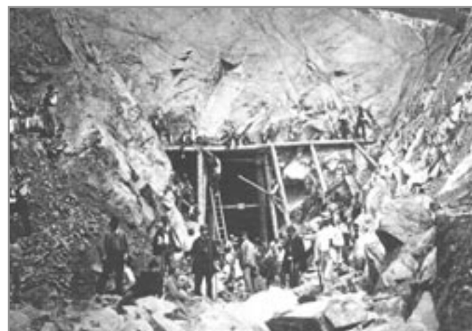
Razba malého prstického tunelu v roce 1869

Ještě pro informaci čtenářů, kteří se zajímají o tuto tematiku, sdělujeme, že v Jihomoravském muzeu ve Znojmě je velice zajímavá výstava z historie této tratě s unikátními fotografiemi a informacemi. Jiří Široký