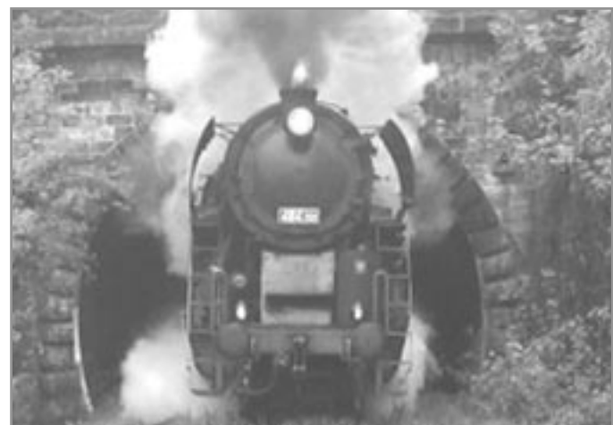
Rosnička vyjíždí z Budkovického tunelu - 5. května 2007

Neumíme si představit práci tisíců dělníků připravujících trasu pro položení kolejnic a „barabů“ stavějících tunely. Dnes známá mechanizace neexistovala, nejčastější pomůcky byly lopaty, krompáče a kolečka. V zápisech obecních rad nejsou informace o tom, kde bylo ubytování těchto lidí. Muselo to být v blízkosti vydatných zdrojů pitné vody, snad v místech strážních domků, kde bývaly studny, nebo se používala voda z potoků tekoucích z Krumlovského lesa. Muselo být zajištěno také jejich stravování. Dnešní