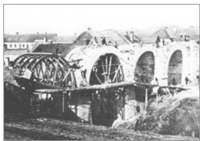
Stavba „Červeného“ viaduktu u Znojma v roce 1869

Co při jízdě vlakem neuvidíme, jsou propustky - průchody