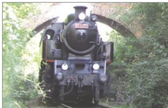
Vlak tažený „Skaličkem“ pod cihelným mostem asi 850 metrů před Moravským Krumlovem.