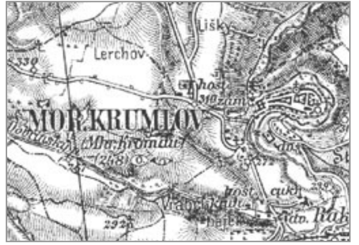
„Speciálka“ byla nejběžnější mapou období I. republiky

Mapy třetího vojenského mapování se staly vyhledávaným podkladem pro nejrůznější odvozené mapy i jiných měřítek. Zvláště oblíbené tehdy byly mapy okresů. To byl také případ našeho okresu, jehož mapu Soudní okres