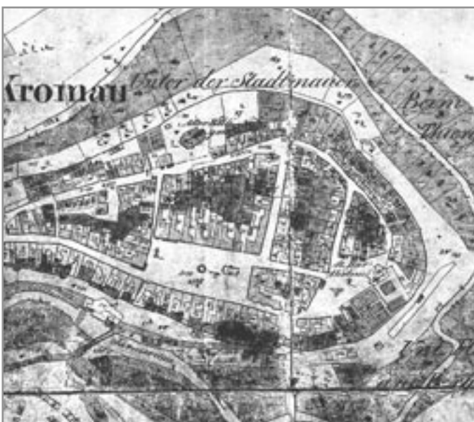
Moravský Krumlov na indikační skice stabilního katastru

Poznámka redakce: Pro snadnější orientaci čtenářů připojujeme odkazy na webová stránky, kde lze některé staré mapy Moravskokrumlovska nalézt: oldmaps.geolab.cz (Müllerova mapa, I-III. vojenské mapování aj), archivnimapy.cz (zejména mapy stabilního katastru).