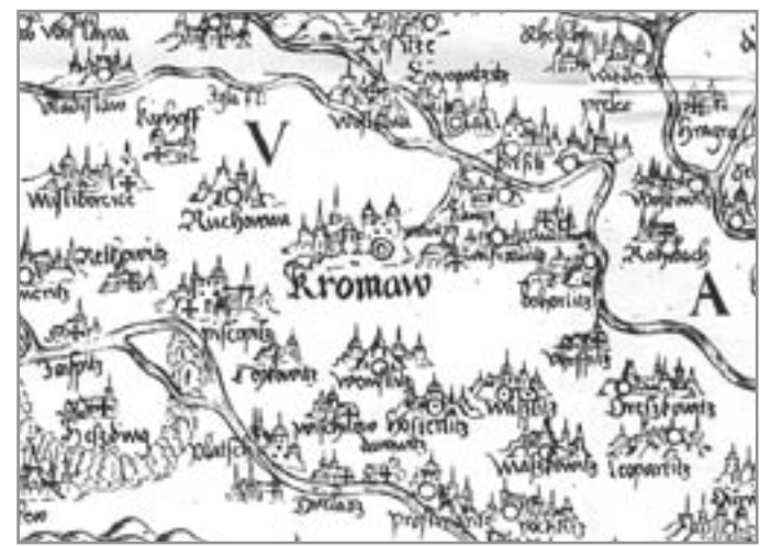
Okolí Moravského Krumlova na Fabriciově mapě Moravy

V roce 1672 mělo město 89 domů „osedlých“ a 55 pustých. V roce 1690 sice celé vyhořelo, ale do pěti let byly zničeny domy, až na 22 pustých míst, znovu postaveny. V tomto období, v roce 1692, vyšla třetí samostatná mapa Moravy, kterou nakreslil rakouský matematik a kartograf, duchovní mimo církevní službu Jiří Matouš Vischer Tyrolský (Moraviae mar-