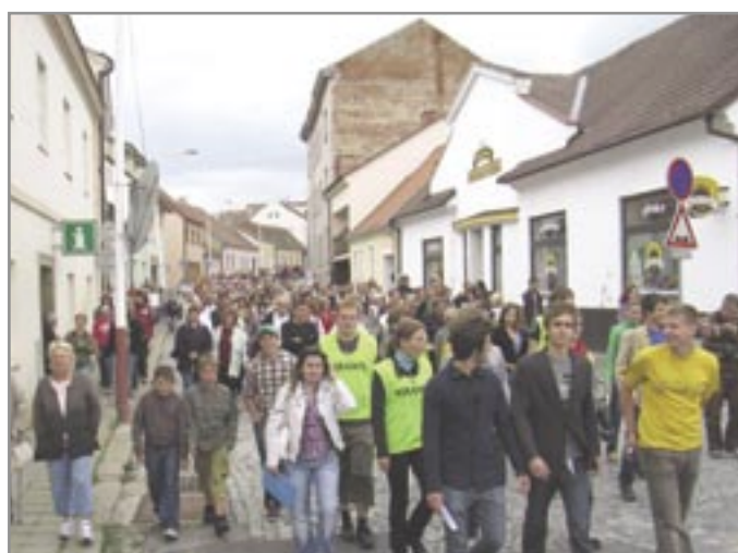
Podpořit studenty a bojovat za Epopej přišly stovky lidí.

„Vlastnické právo Prahy nikdo nezpochybňoval, i když se tu a tam objevila námitka, že Praha nesplnila darovací podmínku. Darovací listinu však nikdo neviděl. V roce 1999 byla podepsána poslední smlouva o výpůjčce pro Moravský Krumlov, která byla prodloužována až do poloviny tohoto roku. Již v roce 2007 začala