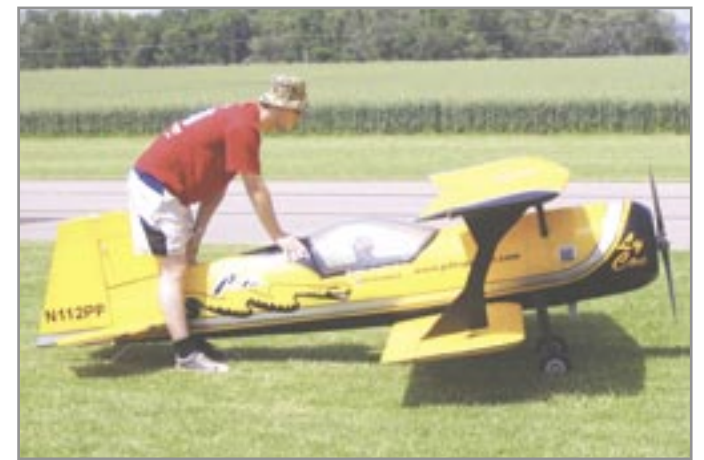
kem z LMK Kyjov.