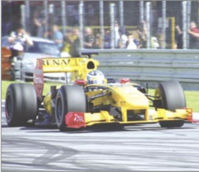
Monopost F1 Renault na brněnském okruhu