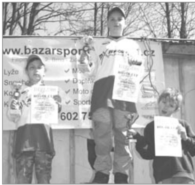
Jezdci Oslavanského Clubu po závodech v Olešnici

Po dlouhé zimě se vydali mladí motokrosoví Oslavanského Mx Junior Clubu k prvním závodům letošní sezóny. Úvodní dva podniky Vysočina MX Cupu se odehrály na tratích v Dalečíně a Dolních Heřmanicích.