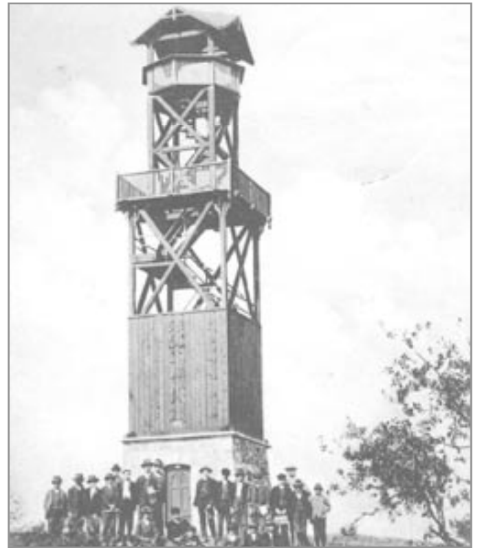
Rozhledna na hlíně