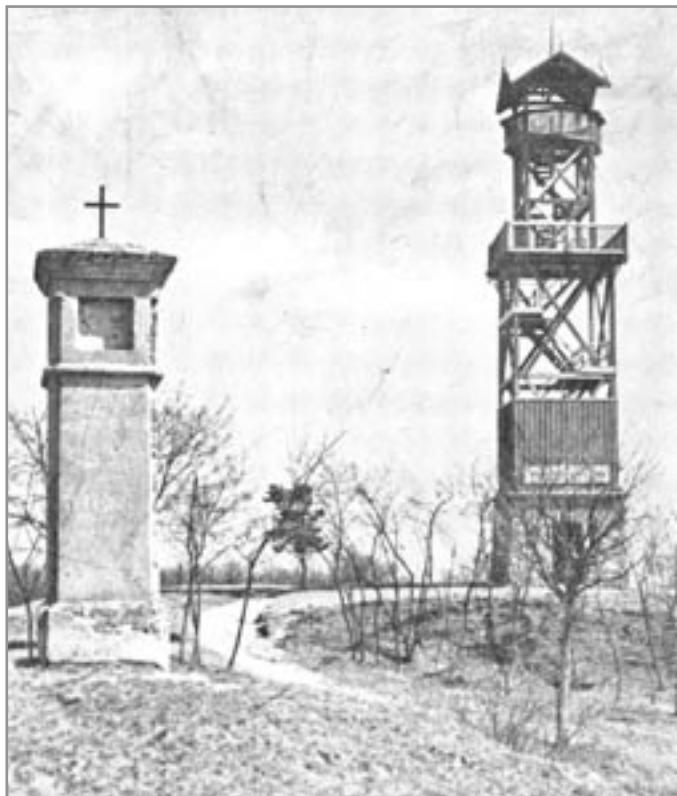
Rozhledna na hlíně