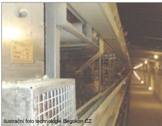
ilustrační foto technologie Begokon CZ

V obci Dolní Dubňany, kde největší stavbou je kravín pro 1200 ks hovězího dobytka, došlo v současné době k situaci, kdy velkokapacitní kravín (VKK) s příslušenstvím koupila silná finanční a podnikatelská skupina Begokon CZ, s.r.o. se sídlem v Českých Budějovicích, která se zabývá velkoprodukcí nosnic a výrobou