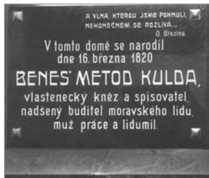
Pamětní deska na rodném domě B. M. Kuldy

POUŽITÉ PRAMENY: • Drápala, D.: Aktivita duchovních na poli vědy a kultury, Rožnov pod Radhoštěm 2003 • Kolektiv autorů: Ivančice, dějiny města, 2002