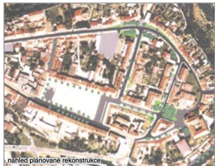
náhled plánované rekonstrukce

V Oslavanech se o to pokusili. Městská policie s Policií ČR vytvořily společné hlídky a kontrolují především podávání alkoholu mladistvým. Dále monitorují pohyb dětí ve večerních hodinách. Tato taktika přinesla i svoje první ovoce. Strážníkům a policistům se podařilo rozkrýt první skupinu vandalů. Jeden z mladíků skončil ve vazbě a druhý se léčí ze své závislosti v detoxikačním centru. Petr Sláma