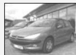
Peugeot 206 1.4i TOP stav! Rok v. 1999 tach. 114 000 km, STK 10/2011 Cena 76.500 Kč