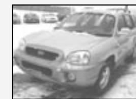
Hyundai Santa Fe 2.0 CRDi GLS TOP stav! Rok v. 2004 tach. 112 500 km, STK 01/2012 Cena 245.900 Kč