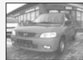
Mazda Demio 1.5i TE Nadstand.vybava! Rok v.12/2001 tach. 124 700 km, STK 02/2012 Cena 119.000 Kč