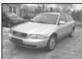
Audi A4 1.9 TDI Bez eko poplatku ABS, Klimatronica! Rok v. 1997 tach. 198 000 km, STK 01/2011 Cena 82.000 Kč