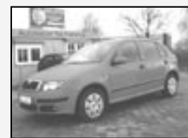
Škoda Fabia 1.2 htp 16V Koupeno v ČR! Rok v. 2007 tach. 45 000 km, STK 10/2010 Cena 127.500 Kč