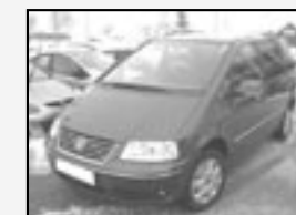
VW Sharan 1.9 TDI Business Nadstandard. výbava! Rok v. 2006 tach. 160 000 km, STK 02/2012 Cena 299.900 Kč