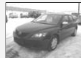
Mazda 3 1.4i TE Sport Spoiler a křídlo! Rok v. 2005 tach. 54 000 km, STK 11/2011 Cena 195.000 Kč