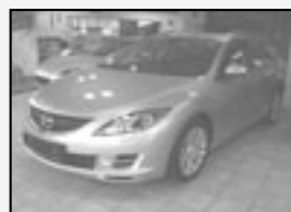
Mazda 6 KOMBI 2.0 CD TE Předváděcí vůz! Rok v. 2009 tach. 20 000 km, STK 02/2012 Cena 509.000 Kč + DPH