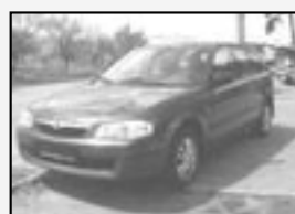
Mazda 323 2.0 DiTD Skladem 3 ks! Rok v. 1998-2000 tach. 155 000 km, STK 12/2011 Cena od 70.000 Kč