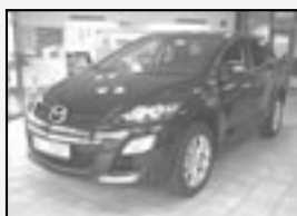
Mazda CX-7 Emotion 2.2D a další modely CX-7! Rok v. 09 tach. 500 km, STK 01/2012 Cena 592.000 Kč + DPH