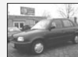
Nissan Micra 1.3i 16V Klima, centrální, imob, Rok v. 1997 tach. 114 000 km, STK 01/2012 Cena 55 500 Kč

Otevřeno: PO-PÁ 9:00-18:00, SO 9:00-13:00, NE po tel. domluvě! Tel.: 736 625 272 E-mail: prodej@piras.cz www.car4me.cz