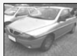
Lancia Y 1,2i Centrální, imobilizér! Rok v. 2000 tach. 122 300 km, STK 01/2012 Cena 45.900 Kč