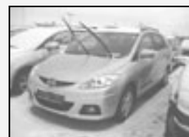
Mazda 5 CD110 TX Předváděcí vůz! Rok v. 2009 tach. 10 500 km, STK 02/2012 Cena 409.990 Kč + DPH