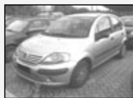
Citroen C3 1.4 HDi DO, el. okna, servo! Rok v. 2003 tach. 148 000 km, STK 01/2012 Cena 111.222 Kč