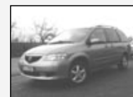
Mazda MPV 2.0 MZR CD, 7 míst! Klima, ABS, ALU, Rok v. 2002 tach. 180 000 km, STK 02/2012 Cena 189.000 Kč