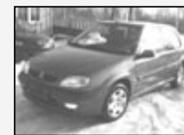
Citroen Saxo 1.4i VTS Klima, servo, DO! Rok v. 2001 tach. 129 876 km, STK 02/2012 Cena 65.900 Kč