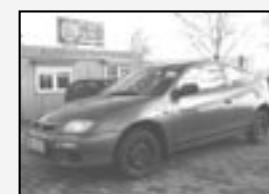
Mazda 323C 1,3i Servo, centrální! Rok v. 1995 tach. 159 000 km, STK 01/2012 Cena 24.990 Kč