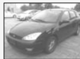
Ford Focus 1.8TDCi Ohia Klima, Alu, el. okna, DO! Rok v. 2001 tach. 158 000 km, STK 02/2012 Cena 99.990 Kč