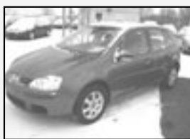
VW Golf 1.9 TDI Trendline TOP stav! 3 ks Rok v. 2007 tach. 55 800 km, STK 01/2012 Cena 329.000 Kč