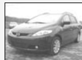
Mazda 5 2.0i Maxi vybava! Rok v. 2005 tach. 48 700 km, STK 11/2011 Cena 290.000 Kč