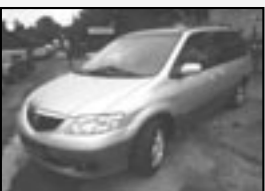
Mazda MPV 2.0 DiCD r.v. 2003, 109 tkm super výbava, servisika cena 208.900 Kč