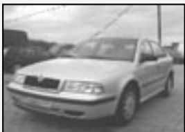
Škoda Octavia 1.4 MPI r.v. 1999, 126 tkm zámeček zpátečky cena 68.000 Kč