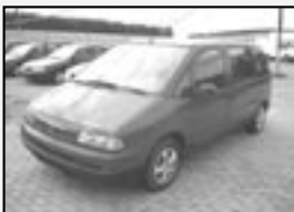
Citroën Evasion 1.9 TD r.v. 1996, 155 tkm 6 míst, klíma cena 79.000 Kč