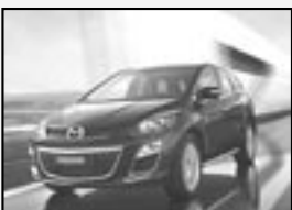
Mazda CX-7 2.2 MZR-CD NOVÉ VOZIDLO! Možnost různé výbavy a barvy. Cena od 729.000 Kč