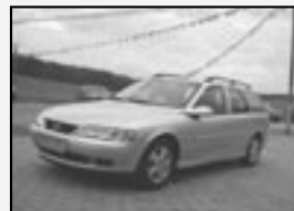
Opel Vectra 1.6i 16V r.v. 1999, 166 tkm digiklíma, cena 89.000 Kč