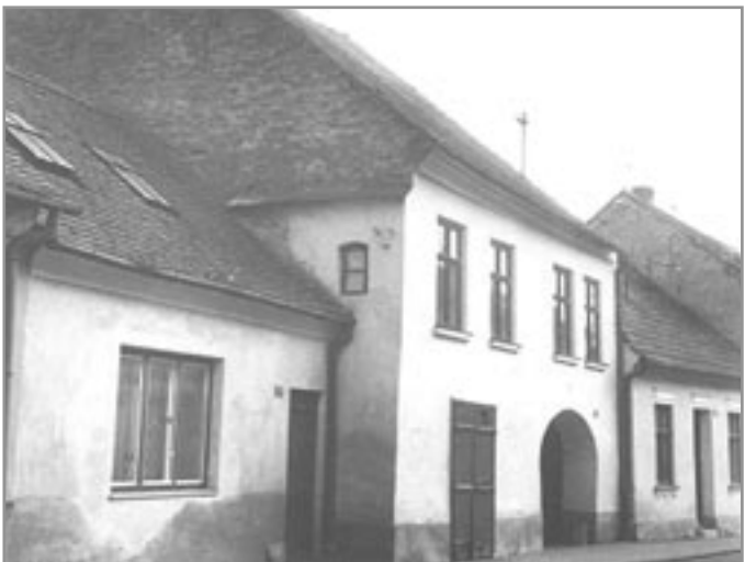
Podivínka - byl v těchto místech počátek židovské obce?

První písemná zmínka o židovských záležitostech v Ivančicích je z roku 1393. V té době již musel být v Ivančicích židovský hřbitov, protože nebylo možné, aby Židé pohřbivali na katolickém hřbitově. Ze zprávy Judasa Bauera z r. 1815 se dovídáme, že „když se rozvodní potok na úpatí, strhává zeminu z břehů a obnažuje hroby, ve kterých se nachází lidské kosti“. Zřejmě se jedná o místo naproti dnešnímu hřbitovu, ale asi o 200 metrů výše proti proudu Mřenkového potoka. Aby se obec vyhnula potížím s potokem, zakoupila místo, kde je dnešní hřbitov.