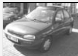
Mazda 121 1.3i 16v r.v. 1992, 159 tkm el. střecha cena 29.000 Kč

Tel.: 723 000 115 E-mail: prodej@piras.cz