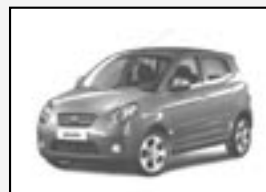
Kia Picanto 1.0i NOVÉ VOZIDLO! Možnost různé výbavy a barvy. Cena od 169.980 Kč