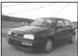
VW GOLF III 1.9TDI GT r.v. 1994, 207 tkm 66 kW, klíma cena 56.000 Kč