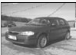
Mazda 323 2.0 DiTD r.v. 2000, 127 tkm klíma AKČNÍ CENA 70.000 Kč