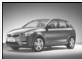
Kia Cee'd 1.4i NOVÉ VOZIDLO! Možnost různé výbavy a barvy. Cena od 289.980 Kč