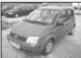
Fiat Panda 1.1i r.v. 2004, 38 tkm cena 112.000 Kč