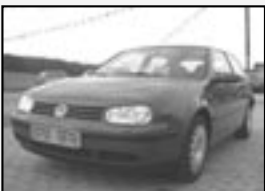
VW Golf IV 1.4i 16V SPORTLINE r.v. 1999, 132 tkm, super výbava cena 104.000 Kč