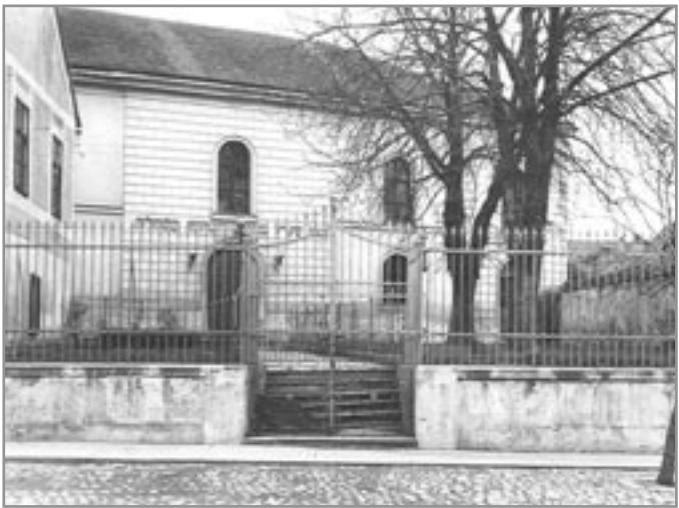
Synagoga v Ivančicích před 1. světovou válkou

Po roce 1848, kdy padla omezení a Židé dosáhli téměř všech práv, jaká měli ostatní občané monarchie, začal jejich počet klesat vystěhovalectvím do větších, dříve zakázaných měst, za lepší obživou. Stěhovali se také do Ivančic - města, kde si postupně zakupovali domy na náměstí.