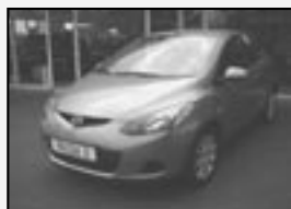
Mazda 2 1.3i TE pro r.v. 2008, 8 tkm klíma cena 229.000 Kč