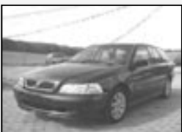
Volvo V40 1.8i LPG! r.v. 1999, 166 tkm provoz 1.20 Kč/km cena 93.000 Kč