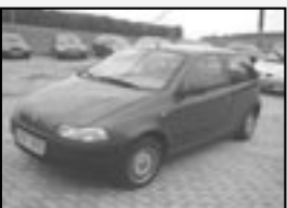
Fiat Punto 1.1i r.v. 1997, 128 tkm cena 36.000 Kč