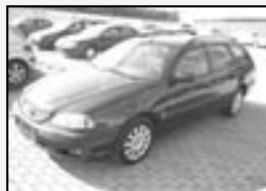
Toyota Avensis 2.0 D-4D r.v. 2002, 131 tkm velmi hezká cena 149.000 Kč