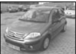
Citroën C3 1.4 HDI r.v. 2006, 128 tkm servisika cena 139.000 Kč