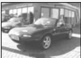
Mazda MX-5 1.6i r.v. 1997, 126 tkm AKČNÍ CENA 70.000 Kč