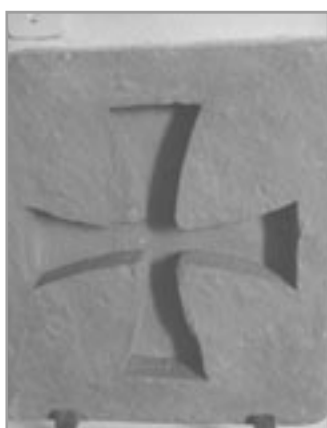
Kámen s templářským křížem