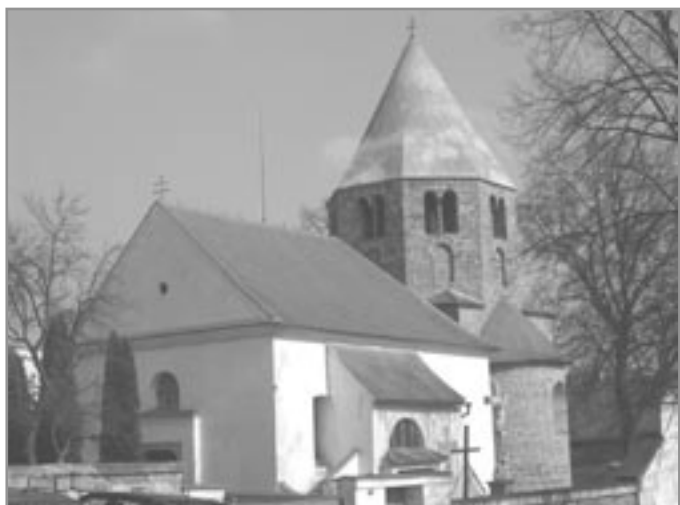
Kostel sv. Petra a Pavla - březen 2008