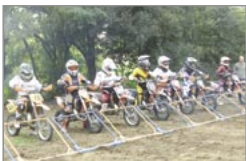
Start motokrosové nadějí