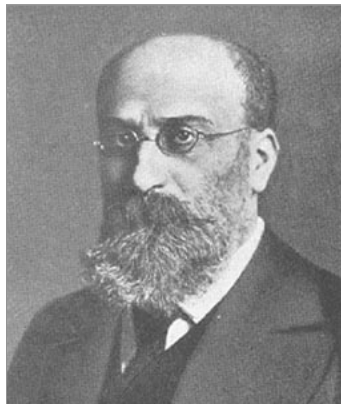
V roce 1927 stal u zrodu Mezinárodní společnosti pro hudební vědu