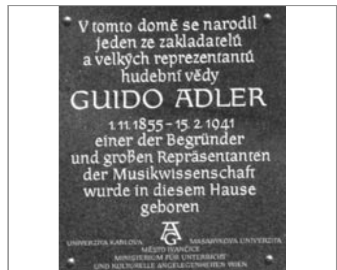
Na jeho rodném domě byla odhalena v roce 1998 pamětní deska

V roce 1885, tedy v prvním roce svého pražského pobytu, se Adler spojil s dalšími významnými badatelskými osobnostmi Phillipem Spittou a K. F. Chrysanterem a společně začali vydávat odborný časopis Vierteljahrsschrift für Musikwissenschaft