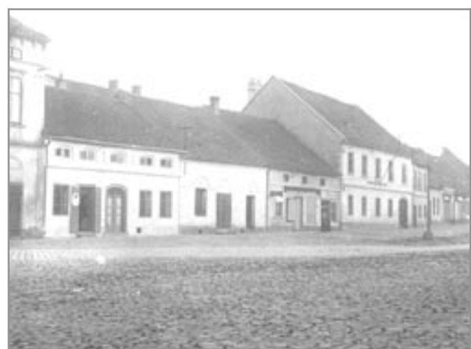
Od října 1930 se gymnázium přestěhovalo na Komenského náměstí

Další změny byly postupné. Pro velký počet tříd i žactva byla v roce 1959-60 z jedenáctileté střední školy vyčleněna jedna samostatná osmiletá základní škola a v roce 1962 byly od jedenácti-