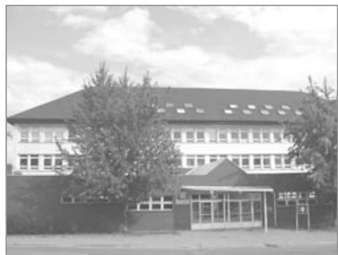
Budova gymnázia v současné době

Použité prameny: • Almanach k 90. výročí založení Gymnázia Jana Blahoslava v Ivančicích - 2009-09-06 • 75 let gymnázia Jana Blahoslava v Ivančicích - 1994 • Pamětní kniha města Ivančice, SOKA Rajhrad, fond C-36.