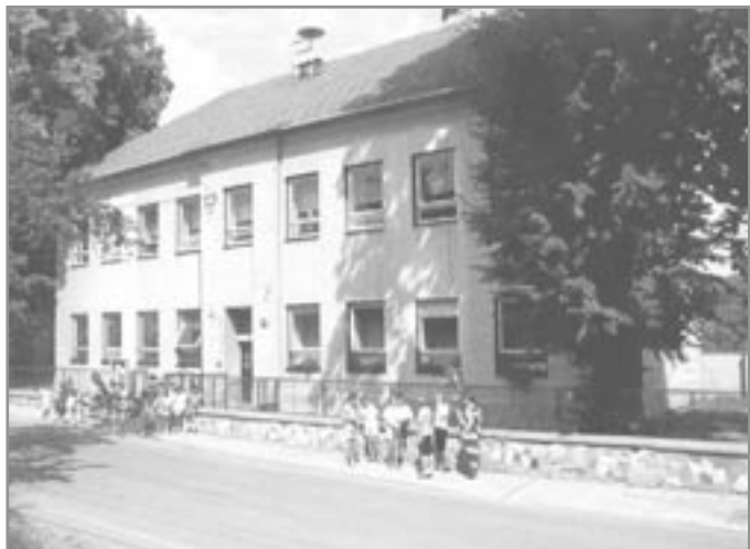
Základní škola v Němčicích