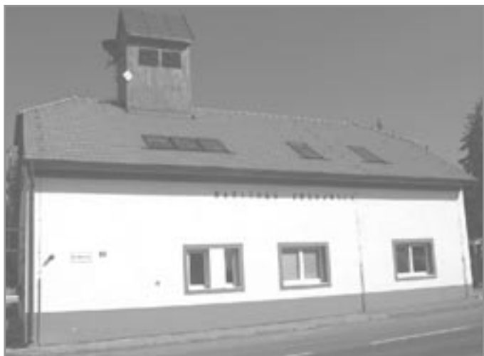
Hasičská zbrojnice v Němčicích po rekonstrukci

V lednu 1949 potvrdit Zemský NV v Brně připojení Němčic, dosud samostatné politické obce k Ivančicím Jiří Široký, tel.: 776 654 494 POUŽITÉ PRAMĚNY: • Pamětní kniha obce Němčice – SOKA Rajhrad, fond C 39 • Moravská vlastivěda, okres ivančický 1904