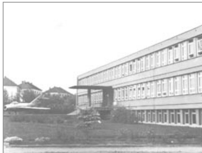
Gymnázium J. Blahoslava

Tak skončila první etapa v historii ivančického gymnázia. Jeho působení bylo úzce spjato se společenským životem města. Škola obohatila kulturní život Ivančic - vystupovala s divadelními představeními, studenti měli svůj orchestr. Pořádaly se žákovské akademie s tělovýchovným