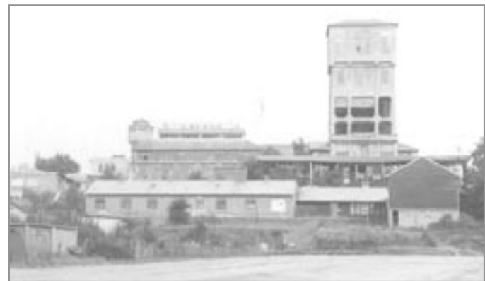
Věž dolu Kukla. Vpravo štít a boční stěna židovského baráku.