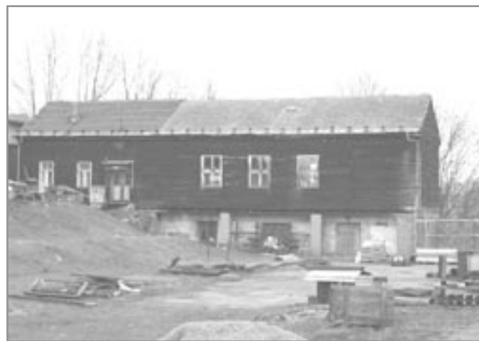
Barák židovského tábora III. - duben 2006.

Snad zázrakem se zachovaly dva dopisy Židů z Kroměříže a ti popisují poměry v dolech jinak: „Některí havíři jsou tak sprostí, jiní méně, ale antisemiti, až na čestné výjimky jsou