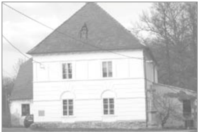
Budova mlýna v Hrubšicích - současný stav.