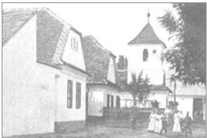
Domy a kaple v Hrubšicích.