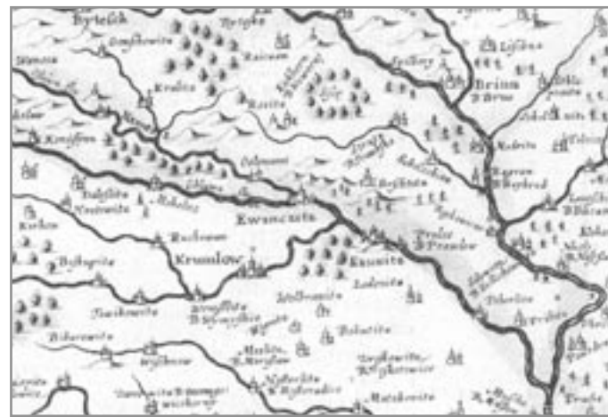
Komenského mapa - kopie z roku 1633

Na východ od města je kopečkovou metodou zakreslena polní trať Nové hory a je vyznačena (zatím nepopsána) kaple sv. Jakuba. Také pásmo Rény je zřetelně