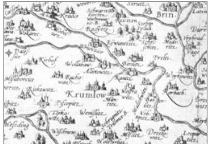
Fabriciova mapa - kopie z roku 1573

Protižidovské nálady vedly v roce 1727 k vydání řady reskriptů císařem Karlem VI. a jeden z nich měl zjistit umístění židovských domů v obcích a vzdálenost těchto obydlí od katolických kostelů. Proto byly pořízeny plány měst a obcí. Protože v Ivančicích žili židé v ghettu, byl pořízen plán, který byl připojen k plánu Mor. Krumlova, který byl pořízen ze stejného důvodu. Židovské domy jsou označeny žlutě, křesťanské červeně. Ve vysvětlivkách je uvedeno, že pod písmenem B je zakreslen