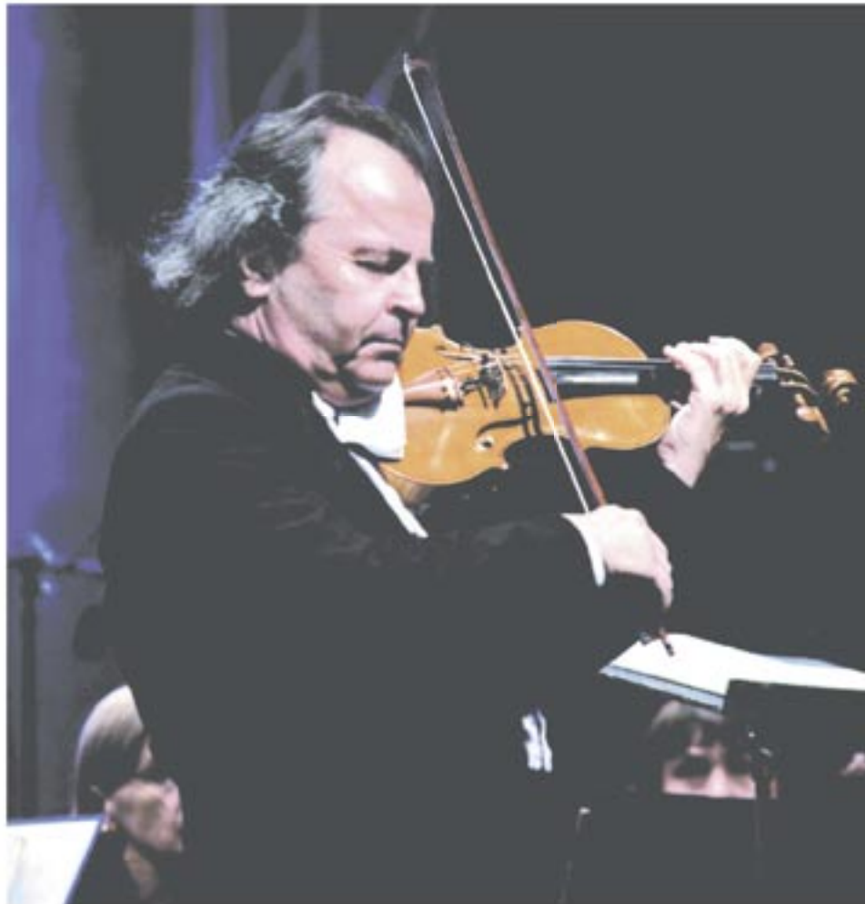
Patron festivalu houslový virtuóz Václav Hudeček.

Skupina ČEZ podporuje v kraji Vysočina kromě jiných oblastí také významným způsobem kulturu. Je generálním partnerem řady hudebních festivalů. Mezi nimi „nejmladší“ je hudební festival „Setkávání Václava Hudečka“, jehož 2. ročník se letos konal v Moravských Budějovicích.