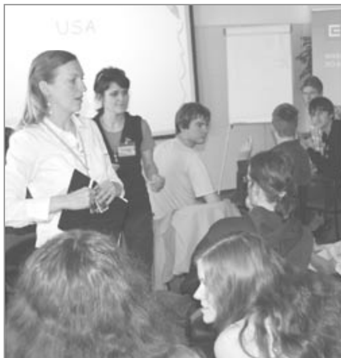
Účastníci jaderné maturity se dokázali nejen soustředit a vzdělávat, ale projevili bojovnost i v různých soutěžích

Přejeme přípravným třídám na Základní škole Moravský Krumlov Ivančická šťastné vykročení do existence! /lef/