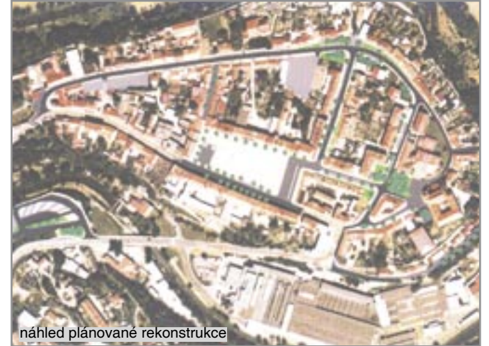
náhled plánované rekonstrukce

Pokud vše dopadne dle představ krumlovských radních, mělo by se v centrální části Krumlova poprvé „kopnout“ na podzim příštího roku. „Informaci je potřeba brát tak, že ne hejtnem slíbil, ale že jsme projednali řešení této nákladné investice a že se rýsuje možnost získat peníze pro tuto investici z úvěru kraje,“ dodal krumlovský starosta. /mape/