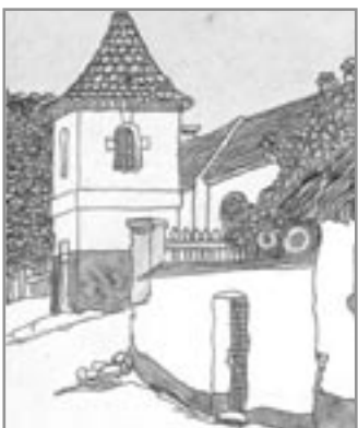
Zvonička před domem č. 7