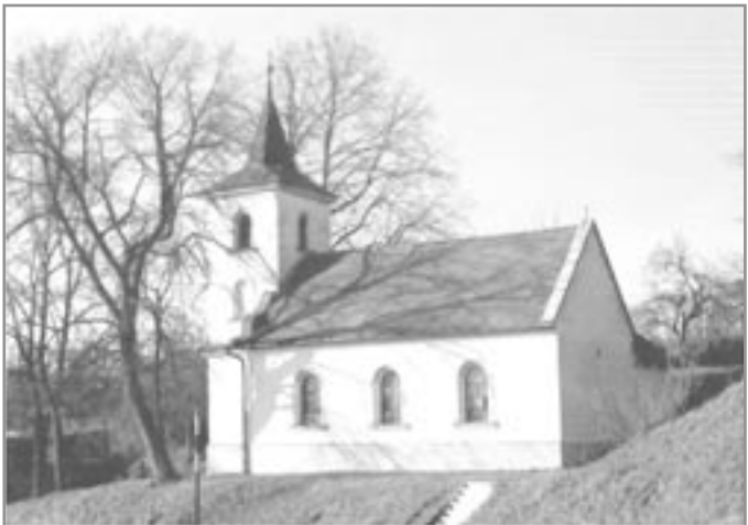
Kaple v Budkovicích

Jiné osídlení o ploše asi 0,2 ha bývalo z doby asi 750 až 400 let př. n. l., tedy ve starší době železné, v blízkosti dřívější vlakové zastávky Budkovic. Z terénu lze vyčíst zbytky opevnění, zčásti znehodnocené stavbou železnice. Musíme připomenout ještě další, nedávno objevené pravěké osídlení, zatím odborně neprozkoumané , na Holém kopci, asi 1 km jižně od zastávky Budkovic. Budou v budoucnu v krumlovském lese ještě další objevy?