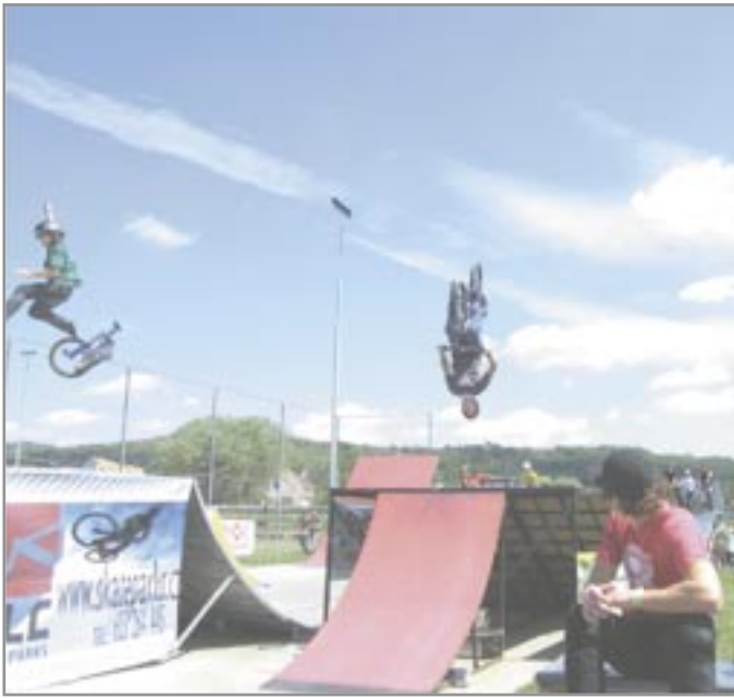
Některé akrobatické prvky vypadaly nebezpečně

V sobotu 23. května se konal již čtvrtý ročník festivalu Freestyle Contestu na stadionu v Ivančicích, letos pod záštitou starosty města Ivančice a poslance Parlamentu ČR MUDr. Vojtěcha Adama. Ivančický skatepark vyrobila firma pana Šulce, který je zároveň pořadatelem festivalu.