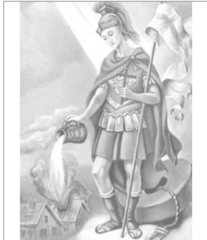
Svatý Florián - patron hasičů

Již 130 let je v Ivančicích hasičská organizace. Do dalších období můžeme popřát hodně prevence, hodně výcviku, ale co nejméně požárů. Jiří Šíroky