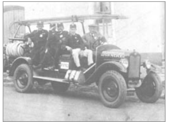
Chevrolet z roku 1926

V dalších letech se Sbor dobrovolných hasičů aktivně zúčastnil