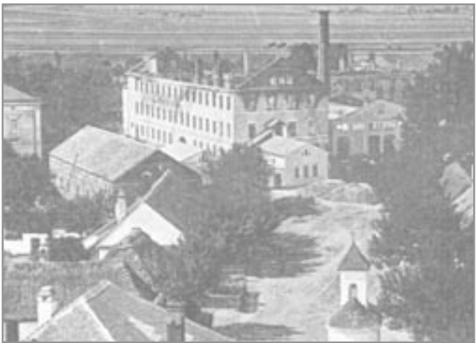
Textilka po požáru v roce 1864

Vilém Kusý roku 1567 zapsal manželce Kateřině z Bílkova na vsi Alexovicích 203 kopy gr. (78 kop gr. jejího věna a 125 kop z lásky manželské). V roce 1574 připadly Alexovice zpět na Krumlov. Za třicetileté války tvrzi zpustla, ale je uvedena při vkladu do zemských desek při prodeji Alexovic Gundakaru z Lichtenštejna v roce 1625. Tvrz stávala blízko vchodu do továrny, kde dnes stojí kříž.