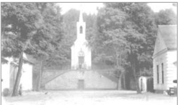
Novogotická kaple z roku 1880

POUŽITÉ PRAMĚNY: Ivančický zpravodaj - různá čísla