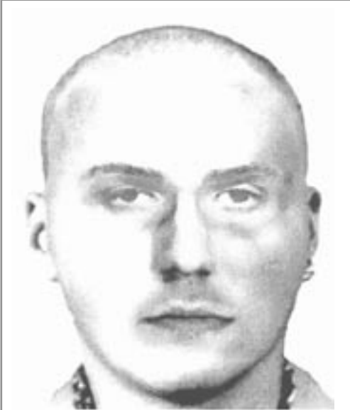
Identikit podezřelého muže

Policie žádá o spolupráci. Ve středu 20. května 2009 byla Krajským ředitelstvím Policie Jihomoravského kraje zveřejněna výzva včetně popisu a identikitů neznámého pachatele, který se začátkem května dopustil sexuálního násilí na dvou dívkách v našem regionu.