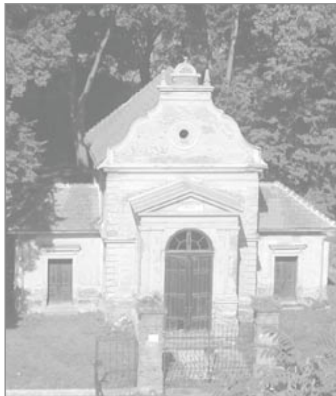
Obřadní hala na ivančickém židovském hřbitově v roce 2005

Figier K., Široký J.: Židovský hřbitov v Ivančicích, vydalo KUC Ivančice 2007