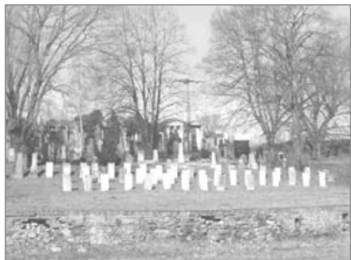
Náhrobky zemřelých z internačního tábora

První světová válka se projevila i na ivančickém hřbitově. Přibýly hroby haličských židů,