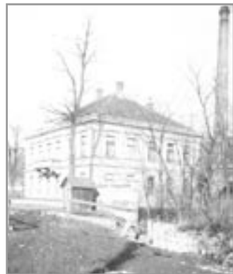
Vila Panovských s elektrárrou