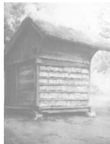
Včelí úl s malovanými panely

Na výstavě zaujme, mimo velkých fotografií osob v historických oděvech, především 12 malovaných včelích panelů, na kterých jsou obrázky umístěny na včelích úlech, nejčastěji jako česna - otvory umožňující vstup včel do úlu a zároveň sloužících k větrání úlu. Nejstarší dochovaný panel je z roku 1758 a znázorňuje Poutí Panny Marie. Od poloviny 18. století do konce 1. sv. války je evidováno přes 600 různých motivů z nichž kolem 150 je umístěno na panelech výstavy v Památku Alfonse Muchy v Ivančicích. /Sj/