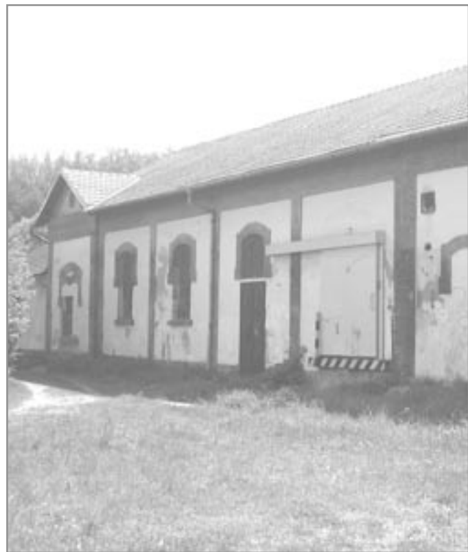
Jatka v Ivančicích, původní budova