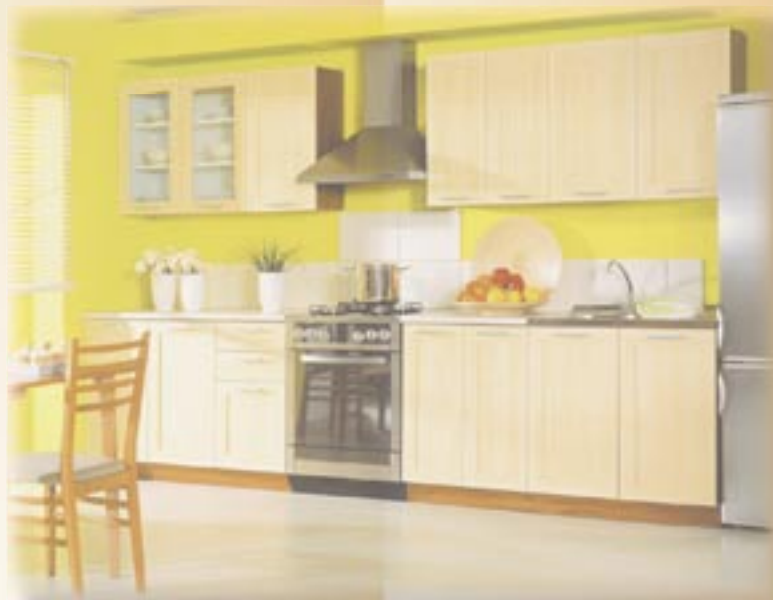
NIKA 260 cm ekran javor 9.810,- Kč