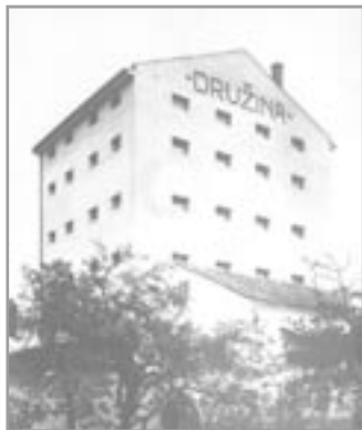
Budova obilního skladu z r. 1936

POUŽITÉ PRAMENY: Pamětní kniha města Ivančice – StOA Rajhrad, fond C-36 • Kolektiv autorů: Ivančice, dějiny města • Ivančické zpravodaje - různá čísla