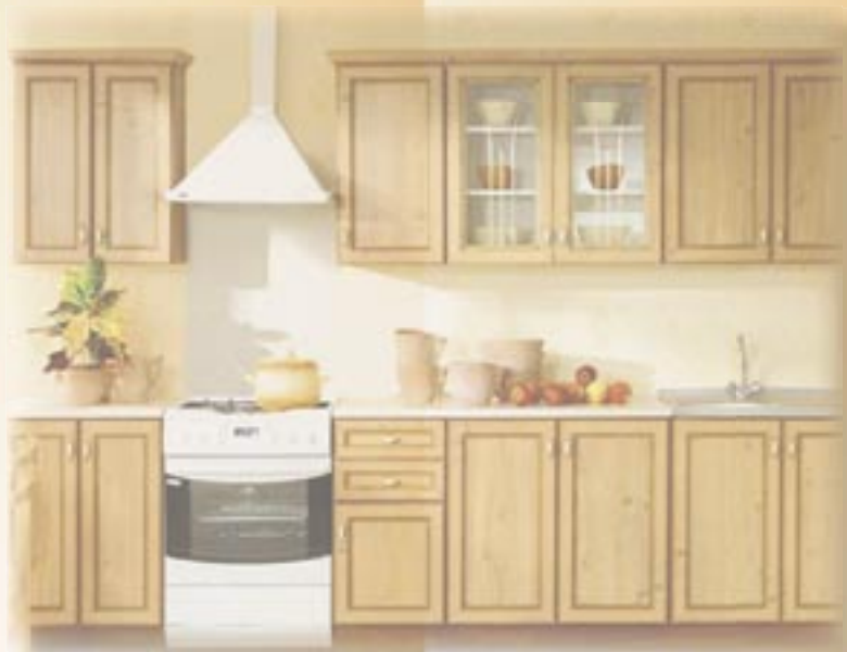
NIKA 260 cm borovice antická 9.810,- Kč

zdarma montáž u zákazníka, prodej na splátky