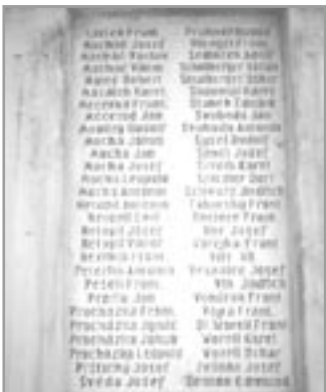
Zadní strana pomníku se jmény

POUŽITÉ PRAMENY: Pamětní kniha města Ivančice - SOKA Rajhrad, fond C-36 • Kolektiv autorů • Ivančice, dějiny města