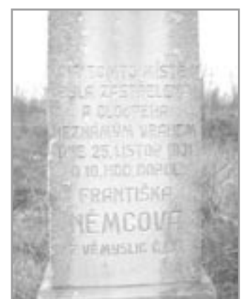
Kříž nad Moravským Krumlovem

Nad Moravským Krumlovem, u státní silnice směrem ke Znojmu, vidíme na kopci zvaném Perk pomník, jehož text vypovídá, co se zde v roce 1931 stalo. Text je doposud dobře čitelný.