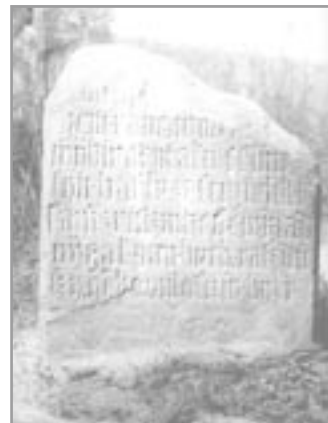
Stará deska zvaná Ptáčník

... GEM RANO W MAJI VY- BIRAT PTAKU SSIMON SYN VASLU ZASTRZELIL SE SAM Z RUTZNITZE NEWI ZIADNY GAK PAN BUCH RATZ DUSI GEHO MILOTIW BYTI 1765.