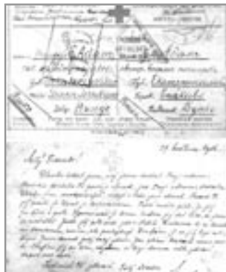
Listek zaslaný přes Červený kříž