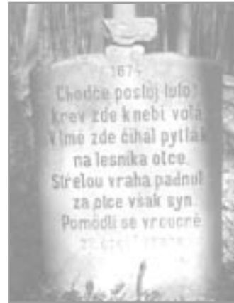
Pamětní deska v lese Anton

V části lesa, zvaném Anton za Podlesím a nad Barborou, je v lese pomníček - deska s nápisem: