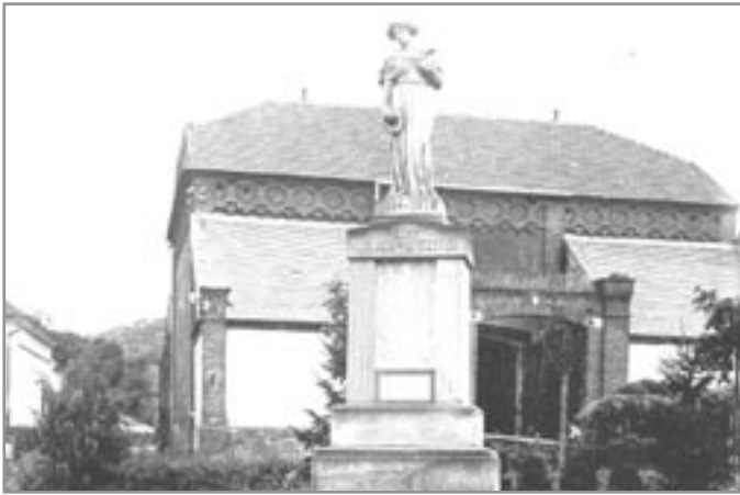
Pomník padlých vojáků v 1. světové válce před kaplí Nejsvětější Trojice

Poklidné období začátku 20. století ukončila 1. světová válka. Záminkou k válce byl sarajevský atentát, při kterém byli zavražděni následník trůnu Ferdinand de Este s manželkou. Dne 27. července 1914 došly do Ivančic první povolávací rozkazy. Druhý den byl vyvěšen manifest vyhlášení války Srbsku a 1. srpna odjížděli z Ivančic první odvedenci. Smutné bylo loučení s rodinami a známými na nádraží, mnozí se viděli naposled. Asi 50 odvedenců z Ivančic a jejich známí se ještě sešli v sokolském domě v Nové ulici v Brně, aby se rozloučili. V dalších dnech následoval tvrdý výcvik a po 14 dnech již byli zařazeni do transportů jedoucích přes Krakov na východní frontu. Po dalších odvozech zůstali v Ivančicích jen staří muži, mladí neschopní vojenské služby, ženy a děti. Počáteční úspěchy na východní frontě se záhy změnily v porážku rakouských vojsk a následkem toho začala pošta doručovat zprávy o prvních mrtvých nebo zajatých.