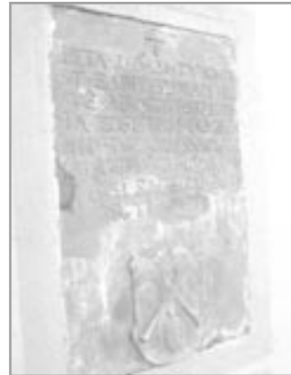
Pamětní deska na ulici Hlavní č. 9 v Oslavanech

Událost připomíná první roky třicetileté války, kdy se po zdejším okolí, hlavně v blízkosti hlavních cest, pohybovala vojska. Nerozhodovalo, zda to byli nepřátelé nebo „naši“. Všichni si násilím vymáhali vše, co potřebovali. A běda tomu, kdo se jim postavil na odpor.