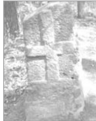
Latinský kříž v katastru Oslavan, datován k roku 1805

V katastru Oslavan, nad cestou do Čučic mezi Rybíčkem a turistickým rozcestníkem Kocoury, se v řídkém lese nachází asi metr vysoká kamenná deska s velkým reliéfem latinského kříže na čelní i zadní straně. Podle místní tradice bylo koncem listopadu roku 1805 v Oslavanech před bitvou u Slavkova několik dní mnoho francouzských vojáků.