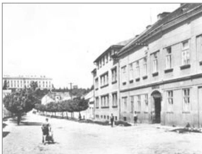
Nemocnice - pohlednice z roku 1955

Prestíž ivančické nemocnice stoupala a 18. února 1904 bylo nemocnici přiznáno postavení veřejného ústavu nesoucího název