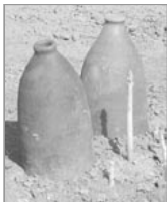
Čerstvý chřest a hliněné troubky - díla ivančických hrncířů