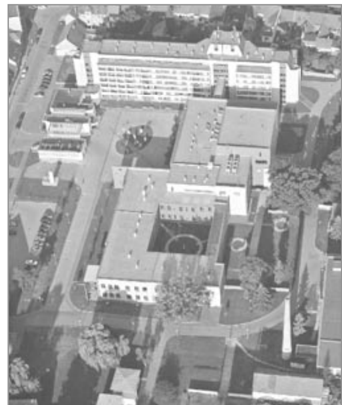
Nemocnice v Ivančicích

Použité prameny: • Čejka J.: Založení nemocnice v Ivančicích • Ivančický zpravodaj 10/2004 • Propagační informace nemocnice