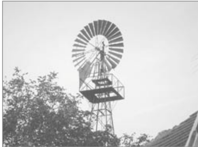
Větrné kolo se tyčí vysoko nad střechy domů

V listopadu loňského roku byla z iniciativy obce Vedrovice opravena technická památka zvaná „větrné kolo“. Akce, při které bylo na vysoký železný stožár jeřábem instalováno opravené kolo, se těšila pozornosti veřejnosti i místních médií. Během podzimu získala nově opravená památka také informační tabuli pro poučení návštěvníků. Doufáme, že poznatky shromážděné při přípravě informačního panelu, zaujmou také čtenáře Zrcadla.