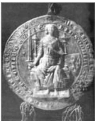
Pečeť z privilegia Václava II. z roku 1288

POUŽITÉ PRAMENY: Kolektiv autorů: Ivančice, dějiny města - 2002 • Kratochvíl A.: Ivančice, býv. král. město na Moravě - 1906