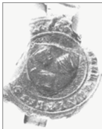
Nejstarší vyobrazení ivančického znaku - pečeť z roku 1382