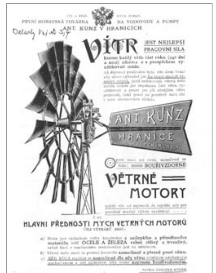
Dobová reklama výrobce větrného kola