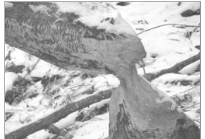
Dílo bobřího dřevorubce na Týnském rybníce (foto Jiří Prokop a Jana Jiráková)

Bobr je ovšem mezi ostatními živočichy celkem výjimečný tím, že aktivně a z lidského pohledu velmi nápadně mění svoje životní prostředí. Zatím co v létě se pase na bylínách a výhoncích dřevin v blízkosti vody (někdy i na zemědělských plodinách), tak na podzim a