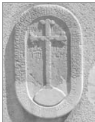
Křížový kámen na zdi hotelu je nenápadnou památkou, kolem které denně chodíme.