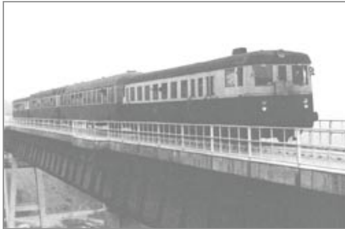
První vlak pravidelné linky na novém viaduktu

V šedesátých letech minulého století již dožíval starý ivančický viadukt. Jeho technický stav a hlavně nárůst provozního zatížení na trati Brno-Hrušovany nad Jevišovkou si vyžádal jeho výměnu. Neumožňoval totiž nasazení těžších motorových lokomotiv, a tak si depo Brno paradoxně muselo ještě koncem sedmdesátých let udržovat stařícké parní lokomotivy řady 434.2, které svým nápravovým tlakem 14 tun pro provoz na mostě vyhovovaly. Také povolená rychlost 25 km/hod neodpovídala požadavkům na tehdejší dopravu. V roce 1968 dokončil brněnský SUDOP projekt nového viaduktu. Projekt byl schválen ministerstvem dopravy v říjnu 1969. Po dalších jednáních a přípravách byla stavba zahájena dne 25. února 1972.