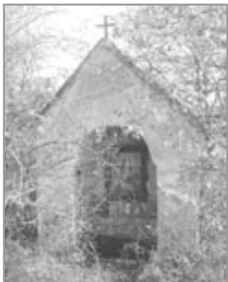
Kaplička ukrytá ve křoví