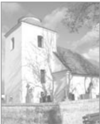
Kostel sv. Leopolda