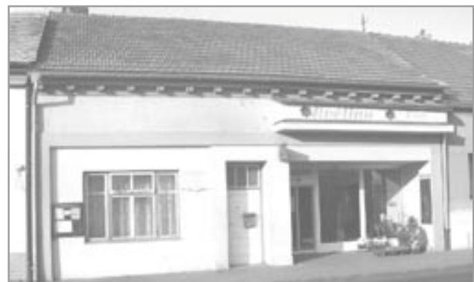
Rodný dům Tomáše Procházky

Pověst ivančických zábav pronikla až do Prahy a v časopise Květy se popisuje v polovině září o besedě v Ivančicích 1. září 1841. Zpívaly se tu lidové písně a na pořadu byla i přednáška o baladě z první Sušilovy sbírky „Proč, kalino v struze stojíš“. Tato zdánlivá maličkost je ve skutečnosti svědectvím zájmu o moravskou lidovou píseň v době, kdy brněn-