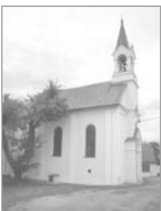
Kaple Narození Panny Marie