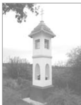
Vzorně opravená boží muka