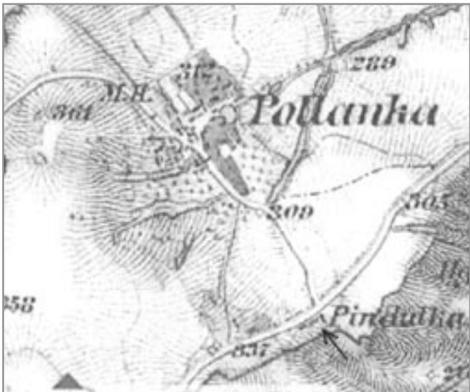
Polánka na mapě z roku 1878 (převzato ze serveru www.geolab.cz). Polohu zájezdního hostince Pindulka ukazuje šipka v pravém dolním rohu.