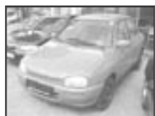
Mazda 121 DB 1,3i servo r.v. 1995, cena 60.000 Kč Mazda 121 DB polokabrio r.v. 1992, cena 35.000 Kč