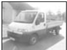
Fiat Ducato 2,5D valník r.v. 1996, cena 100.000 Kč tach.: 180 tis. km, bílá cena bez DPH, velmi dobrý stav