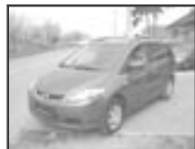
Mazda 5 1,8i N1 (bez DPH) r.v. 2007, cena 399.000 Kč tach.: 7,5 tis. km, tm. červ. m. aut. klima, 6x airbag, ABS, posil., tachograf, CD, centrál