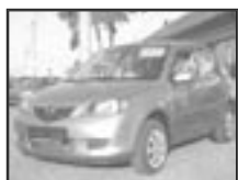
Mazda 2 1,25i r.v. 2004, cena 175.000 Kč tach.: 85 tis. km, sv. mod. metal 4x airbag, ABS, imobil., posil., tón. skla, el. př. okna, centrál