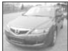
Mazda 6 1,8i kombi r.v. 2005, cena 340.000 Kč tach.: 86 tis. km, tm. šed. met. klima, 8x airbag, ABS, ASR, litá kola, el. zrc. a okna, centrál