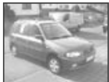
Mazda Demio 1,3i r.v. 1998, cena 120.000 Kč tach.: 129 tis. km, tm. modrá m. klima, 2x airbag, ABS, centrál., el. okna a zrc. zad. stěrač, tón. skla