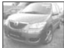
Mazda MPV 2,0 MZR CD r.v. 2004, cena 345.000 Kč tach.: 125 tis. km, modrá met. klima, 4x airbag, ABS, imobil., el. zrc. a okna, centrál s DO