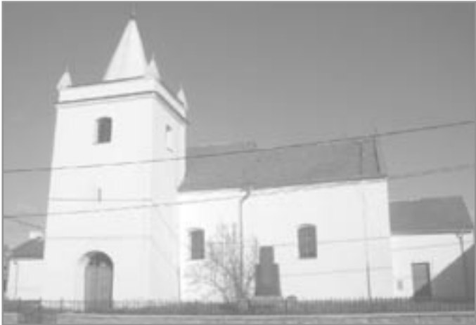
Dominantou vesnice je kostel Nanebevzetí Panny Marie

Nejstarší sídlo templářské komendy snad charakteru tvrze, bylo pravděpodobně na vyvýšeném místě jihovýchodně od kostela, v prostoru domů popisné číslo 43 a 44, kde se dříve přišlo na základy mohutných zdí.