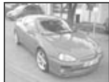
Mazda MX3 1,8i V6 r.v. 1994, cena dohodou tach.: 130 tis. km, červená perfektní stav, koupeno v CZ, první majitel