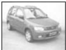
Mazda Demio 1,5i r.v. 2001, cena 150.000 Kč tach.: 110 tis. km, červená klima, 4x airbag, ABS, centrál., el. okna, mlhovsky, tón. skla