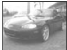
Mazda MX5 NB 1,8i r.v. 2000, cena 265.000 Kč tach.: 81 tis. km, černá met. 2x airbag, rádio, zhrmovací střeška, litá kola, el. zrc.