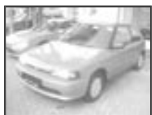
Mazda 323 BG 1,3i r.v. 1990, cena 35.000 Kč tach.: 142 tis. km, červená rádio, centrál., manuál., velmi dobrý stav