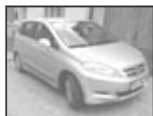
Honda FR-V 1,8 i-TEC r.v. 2005, cena 345.000 Kč tach.: 79 tis. km, str. metal aut. klima, 6x airbag, ESP, ASR, EDS, ABS, 6 rychlostí