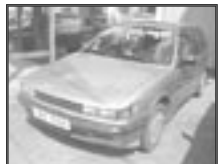
Mitsubishi Colt 1,5i r.v. 1990, cena 24.000 Kč tach.: 200 tis. km, sv. m. met. centrál., zadní stěrač, tón. skla, el. okna a zrc. posil.