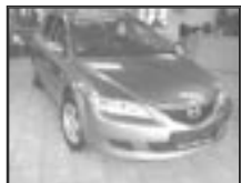
Mazda 6 2,0 MZR r.v. 2003, cena 295.000 Kč tach.: 121 tis. km, tm. šed. m. aut. klima, 8x airbag, ABS, ESP, ASR, temp., el. výbava