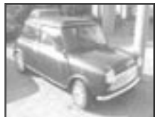
Mini cooper 1,3 r.v. 1999, cena 200.000 Kč tach.: 10 tis. km, tm. zel. m. rádio, zhrmovací střeška, litá kola, manuál., původní stav