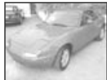
Mazda MX5 cabriolet r.v. 1992, cena 100.000 Kč tach.: 151 tis. km, červená rádio, el. okna, zhrmovací střeška, posil.