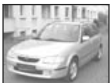
Mazda 323 BJ 2,0 DITD r.v. 1999, cena 125.000 Kč tach.: dva vozy, 4x airbag, ABS, el. okna a zrc., rádio, centrál