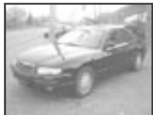
Mazda Xedos 9 2,5i r.v. 1994, cena 90.000 Kč tach.: 130 tis. km, tm. červ. m. aut. klima, 2x airbag, alarm, palub. PC, litá kola, el. výbava