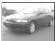
Mazda 323 2,0 Di - klima r.v. 1998, cena 68.000 Kč tach.: 190 tis. km, tm. mod. metal klima, 2x airbag, ABS, rádio, imobil., centrál., el. okna a zrc.