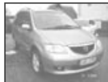
Mazda MPV 2,0 MZR CD r.v. 2003, cena 295.000 Kč tach.: 115 tis. km, sv. mod. m. klima, 4x airbag, ABS, imobil., el. zrc. a okna, centrál s DO