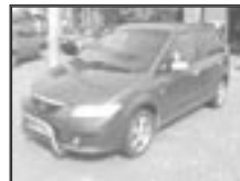
Mazda Pemacy 2,0 DITD r.v. 2003, cena 249.000 Kč tach.: 119 tis. km, tm. mod. m. aut. klima, 4x airbag, ABS, el. zrc. a okna, centrál., mlhovsky