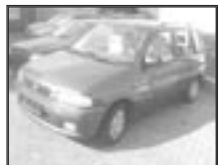
Mazda Demio 1,3i r.v. 1999, cena 129.000 Kč tach.: 62 tis. km, tm. mod. m. klima, 2x airbag, rádio, el. okna a zrc., mlhovsky, tón. skla