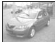
Mazda 3 1,6 sport r.v. 2004, cena 275.000 Kč tach.: 37 tis. km, modrá met. aut. klima, 8x airbag, ABS, ASR, ESP, max. el. výbava