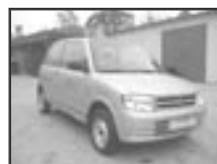
Daihatsu Cuore 1,0i r.v. 1999, cena 70.000 Kč tach.: 72 tis. km, sv. zel. metal rádio, imobil., manuál., posilovač řízení, tón. skla

Vyřízení pojistných událostí u smluvních pojišťoven