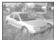
Ford Mondeo 1,8i klima r.v. 1995, cena 45.000 Kč tach.: 152 tis. km, str. metal klima, 2x airbag, ABS, manuál., posil., tón. skla, el. zrc.