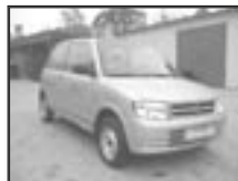
Daihatsu Cuore 1,0i r.v. 1999, cena 70.000 Kč tach.: 70 tis. km, sv. zel. metal, rádio, imobil., manuál., posilovač řízení, tón. skla

Vyřízení pojistných událostí u smluvních pojišťoven