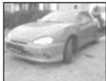
Mazda MX3 1,8i r.v. 1993, cena 54.000 Kč tach.: 195 tis. km, červená, ABS, rádio, centrální, el. okna a zrc., posil., mlhovky