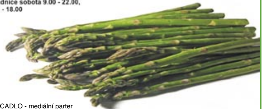
čtrnáctideník ZRCADLO - mediální partner

9.00 STEJŠN - hardrockový svižník 11.00 OPICE V AFRICE - divadelní pohádka 12.00 MAŽORETKY SVČ 12.30 MELODY MUSIC - populární kapela 14.30 ABBA - revival 16.00 POUTNÍCI - country kapela