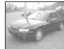
Mazda Xedos 9 2,5i r.v. 1994, cena 90.000 Kč tach.: 130 tis. km, tm. červ. m. aut. klima, 2x airbag, alarm, palub. PC, litá kola, el. výbava