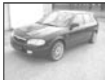
Mazda 323 F 1,5i sport r.v. 1999, cena 129.000 Kč tach.: 112 tis. km, černá met. klima, 4x airbag, ABS, litá kola, imob., mlhovky, centrální