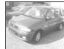
Mazda Demio 1,3i r.v. 1999, cena 129.000 Kč tach.: 76 tis. km, tm. mod. m. klima, 2x airbag, rádio, el. okna a zrc., mlhovky, tón. skla