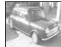
Mini cooper 1,3 r.v. 1994, cena 200.000 Kč tach.: 10 tis. km, tm. zel. m. rádio, zhrnovací střecha, litá kola, manuál., původní stav