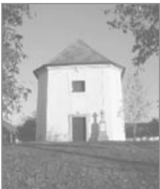
Kaple zasvěcená sv. Floriánovi