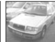
Škoda Felicia kombi 1,3 r.v. 2000, cena 69.000 Kč tach.: 163 tis. km, str. metal centrální, el. okna, litá kola, tón. skla, zadní stěrač