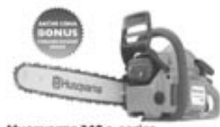
Husqvarna 345 e-series Univerzální pila s nerezovým řetězcem s nastavitelnou délkou řetězce. Široký řetěz s poloměrnými zuby, 40 minutový jehlový akumulátor na lihele s nastavitelnou rychlostí. Výkon 2,2 kW/3,0 k - délka řetězce 137 cm - hmotnost řetězce 4,8 kg. Sekačový nástroj je pouze s příslušenstvím pro obousměrnou údržbu a údržbu. Výška sekačky 122 cm

Můžeme za 9.990 Kč Akční cena 9.990 Kč NEJEDNODUPĚLNĚ 999 Kč