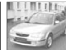
Mazda 323 BJ 2,0 DITD r.v. 2000, cena 125.000 Kč r.v. 1999, cena 129.000 Kč r.v. 1999, cena 125.000 Kč