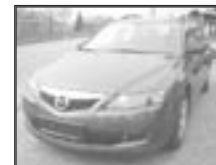
Mazda 6 1,8i kombi r.v. 2005, cena 340.000 Kč tach.: 86 tis. km, tm. šed. met. klima, 6x airbag, ABS, ASR, litá kola, el. zrc. a okna, centrální