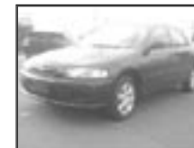
Mazda 323 2,0Di - klima r.v. 1998, cena 68.000 Kč tach.: 190 tis. km, tm. mod. metal, klima, 2x airbag, ABS, rádio, imobil., centrální, el. okna a zrc.