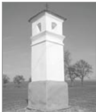
Boží muka „U zmrzlých Saxů“