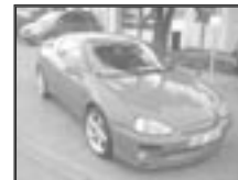
Mazda MX3 1,8i V6 r.v. 1994, cena 200.000 Kč tach.: 130 tis. km, červená, met. perfektní stav, koupeno v CZ, první majitel