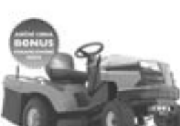
Husqvarna CT151 Univerzální zahradní traktor s integrovanou dělicí součástí a systémem TriacClip (nastavitelná). Motor Kohler 15,0 k - síla sekačky 92 cm - hmotnost 220 kg. Sekačový nástroj je zahrnut součástí a údržba je 122 cm

Můžeme za 10.590 Kč Akční cena 10.590 Kč NEJEDNODUPĚLNĚ 1.099 Kč