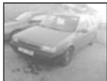
Fiat Tipo 1,4ie r.v. 1990, cena 24.500 Kč tach.: 168 tis. km, vin. metal, centrální, el. okna, tón. skla, manuál. převod., zadní stěrač