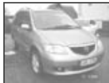
Mazda MPV 2,0 MZR CD r.v. 2003, cena 295.000 Kč tach.: 115 tis. km, sv. mod. m. klima, 4x airbag, ABS, imobil., el. zrc. a okna, centrální s DO