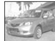
Mazda 2 1,25i r.v. 2004, cena 175.000 Kč tach.: 85 tis. km, sv. mod. metal, 4x airbag, ABS, imobil., posil., tón. skla, el. př. okna, centrální