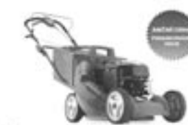
Husqvarna R 145SV Elektronická sekačka s proměnlivou rychlostí pootáčení. Systém TriacClip, robustní ocelové řezací listy, chromizované nástroje výšky sekačky. Motor 145 cc - síla sekačky 31 cm - výška sekačky 30-91 mm - objem kosa 30 l

Můžeme za 11.990 Kč Akční cena 11.990 Kč NEJEDNODUPĚLNĚ 1.999 Kč