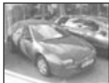
Mazda 323 F 1,8i BA r.v. 1997, cena 70.000 Kč tach.: 190 tis. km, tm. červ. met. klima, 2x airbag, ABS, posil., rádio, imobil., el. zrc. a okna