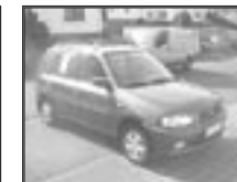
Mazda Demio 1,3i r.v. 1998, cena 120.000 Kč tach.: 129 tis. km, tm. modrá m. klima, 2x airbag, ABS, centrální, el. okna a zrc. zad. stěrač, tón. skla