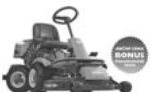
Husqvarna Rider 16C AWD Přiblíží na vašeho koně výkonný čtyřkolový traktor s integrovanou dělicí součástí a systémem TriacClip (nastavitelná). Motor Kohler 16,5 k - síla sekačky 90 cm - výška sekačky 30-80 mm - hmotnost 250 kg. Sekačový nástroj je zahrnut součástí a údržba je 122 cm

Můžeme za 63.900 Kč Akční cena 63.900 Kč NEJEDNODUPĚLNĚ 6.399 Kč