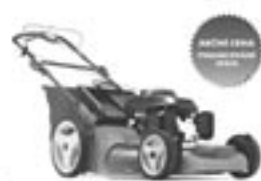
Husqvarna R 535V Výkonná sekačka s proměnlivou rychlostí pootáčení. Elektronický systém TriacClip, Motor Honda 535 cc - síla sekačky 51 cm - výška sekačky 30-80 mm - objem kosa 30 l

Můžeme za 11.990 Kč Akční cena 11.990 Kč NEJEDNODUPĚLNĚ 1.999 Kč