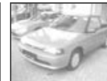
Mazda 323 BG 1,3i r.v. 1990, cena 29.000 Kč tach.: 145 tis. km, červená, rádio, centrální, manuál., velmi dobrý stav