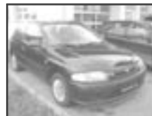
Mazda 323 P 1,3i r.v. 1998, cena 70.000 Kč tach.: 75 tis. km, tm. mod. met. 2x airbag, rádio, centrální, imobil., zadní stěrač, posil.