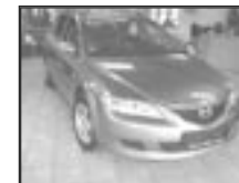
Mazda 6 2,0 MZR r.v. 2003, cena 320.000 Kč tach.: 130 tis. km, tm. šed. m. aut. klima, 6x airbag, ABS, ESP, ASR, temp., el. výbava