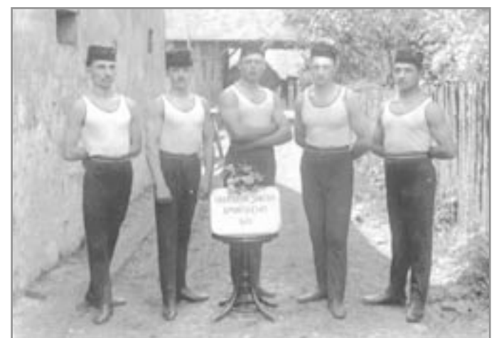
Ivančice - odvedenci (1913)

Počátkem dvacátého století byl pro jednotu nadmíru příznivý. O práci ve spolku byl velký zájem a jeho činnost byla tehdy velmi rozsáhlá a pestrá. V říjnu 1901 po veřejné přednášce „Cvičení žen v Brně“, která měla u místních žen velký ohlas, byl nejdřív zřízen při ivančické sokolské jednotě odbor cvičících žen a v dubnu roku 1904 již odbor zcela splnul s jednotou, když výbor spolku přijal cvičící ženy jako řádné členky. Ivančické ženy byly bezpochyby průkopnicemi ženského sokolského tělocviku snad na celé Moravě.