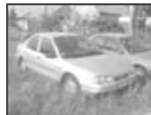
Ford Mondeo 1,8i klima r.v. 1995, cena 45.000 Kč tach.: 152 tis. km, str. metal, klima, 2x airbag, ABS, manuál., posil., tón. skla, el. zrc.