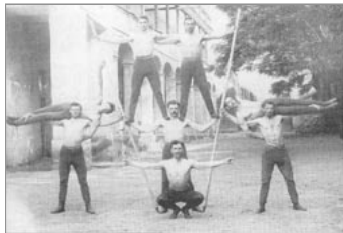
Cvičení iv. Sokolů (1912)

První cvičili členové jednoty 11. března 1887 v tělocvičně, kterou spolu s ještě jednou místností spolku poskytlo bezplatně město Ivančice. Brzy však byla jednota z propůjčených prostor vykazána. Nějakou dobu se cvičilo na dvoře kasáren a konečně od 1. července 1888 měli sokoli od města pronajaty dvě místnosti ve dvoře kasáren za 60 zlatých ročně. V těchto prostorách prožila místní sokolská jednota víc jak polovinu