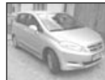
Honda FR-V 1,8 i-TEC r.v. 2005, cena 345.000 Kč tach.: 79 tis. km, str. metal, aut. klima, 6x airbag, ESP, ASR, EDS, ABS, 6 rychlostí