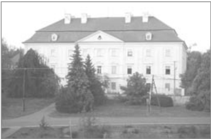
Zámek je památkou na dobu, kdy Tulešice byly sídlem panství