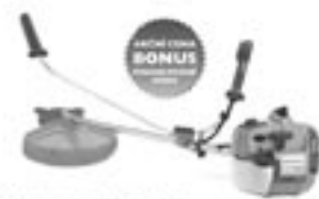
Husqvarna 323R Tento lehký a výkonný kosač má sklopnou prodlouženou a nastavitelnou pracovní šířku. Širokoúhelný sekačový prvek nabízí pohodlnou pracovní polohu. Je to zároveň lehká a rozsvětlená sekačka. Výška sekačky 30-80 mm - kapacita kosa 30 l

Můžeme za 15.490 Kč Akční cena 15.490 Kč NEJEDNODUPĚLNĚ 1.599 Kč