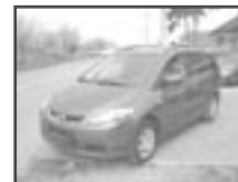
Mazda 5 1,8i N1 (bez DPH) r.v. 2007, cena 399.000 Kč tach.: 7,5 tis. km, tm. červ. m. aut. klima, 6x airbag, ABS, posil., tachograf, CD, centrální