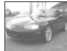
Mazda MX5 NB 1,8i r.v. 2000, cena 264.000 Kč tach.: 81 tis. km, černá met. 2x airbag, rádio, zhrnovací střecha, litá kola, el. zrc.