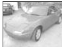
Mazda MX5 cabriolet r.v. 1992, cena 100.000 Kč tach.: 151 tis. km, červená, rádio, el. okna, zhrnovací střecha, posil.