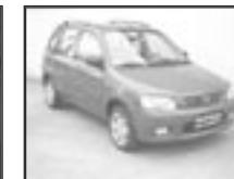
Mazda Demio 1,5i r.v. 2001, cena 150.000 Kč tach.: 110 tis. km, červená, klima, 4x airbag, ABS, centrální, el. okna, mlhovky, tón. skla