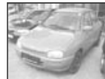
Mazda 121 DB 1,3i servo r.v. 1995, cena 60.000 Kč tach.: 141 tis. km, červená, centrální, manuál., posil., nastav. volant, tón. skla, otáčkoměr