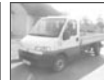
Fiat Ducato 2,5D valník r.v. 1996, cena 100.000 Kč tach.: 180 tis. km, bílá, cena bez DPH, velmi dobrý stav