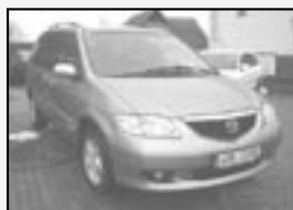
Mazda MPV r.v. 2003, cena 299.000 Kč tach.: 105 tis. km, zelená metal. klima, 4x airbag, ABS, alu kola, el. okna, posíl., orig. rádio