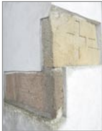
Náhrobní nebo křížové kameny

Dosavadní náhodné archeologické nálezy z „hradiska“ zatím nepotvrdily existenci šlechtického sídla v třináctém století. Nalezená keramika pochází až z druhé poloviny století čtrnáctého. Současná terénní situace také zcela neodpovídá požadavkům na sídlo jednoho z nejmocnějších mužů v zemi. Lokalizaci tajemného Dubna do Dolních Dubňan nemůžeme tedy zatím považovat za spolehlivě prokázanou. Zdá se pravděpodobnější, že „hradisko“ je spíše pozůstatkem skromnějšího sídla místní nižší šlechty až ze 14. století.