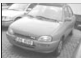
Mazda 121 DB 1,3i r.v. 2003, cena 35.000 Kč tach.: 124 tis. km, červená rádio, centrála, nehavarované, kou- peno v CZ, servisní knížka