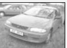
Mazda 323 1,5i sedan r.v. 1995, cena 39.000 Kč tach.: 165 tis. km, červená 1. majitel, nehavarované, centrála, posíl., otáčkoměr, manuál, převod.