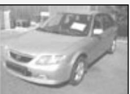
Mazda 323 F 2,0 DITD r.v. 2003, cena 179.000 Kč tach.: 113 tis. km, stříbrná metal. klima, 4x airbag, ABS, orig. rádio, imobil, posíl., alu kola, el. okna a zrc.