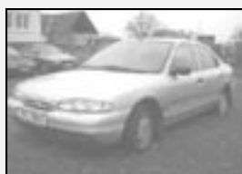
Ford Mondeo 1,8i r.v. 1995, cena 39.000 Kč stříbrná metaliza 1. majitel, nehavarované, servisní knížky, dobrý stav

Vyřízení pojistných událostí u smluvních pojišťoven