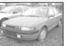
Mazda 323 1,6i r.v. 1990, cena 19.000 Kč tach.: 180 tis. km, červená mlhovky, stav doby, koupeno v CZ