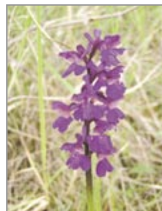
„orchidej“ vstavač kukačka

tají vaši pozornost žluté koberce mochny písečné. Méně nápadné jsou porosty drobné bílé osívky jarní. Z méně častých druhů zaujme křivatec český, ostřice nízká, koniklec obecný, později také koniklec luční. V pozdním jaru a v létě jsou všude hojně nápadné druhy rozrazil klasnatý, hvozdík kartouzek, kručinka chlupatá, se-