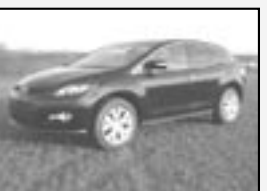
Mazda CX7 DISI REVOLUTION r.v. 2008, cena 699.000 Kč + DPH tach.: 1 tis. km, černá aut. klima, 8x airbag, ABS, ASR, ESP, alu kola, 4x4, max. el. vybava