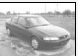
Opel Vectra 2,0 TD r.v. 1997, cena 66.000 Kč tach.: 135 tis. km klima, 2x airbag, ABS, posíl., alu kola, imob., centrála, dálk., mlhovky, tón. skla