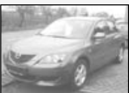
Mazda 3 1,6i TE sport r.v. 2003, cena 269.000 Kč tach.: 55 tis. km, modrá metal aut. klima, 6x airbag, ABS, ASR, CD, posíl., imob., el. zrc. a okna, centrála