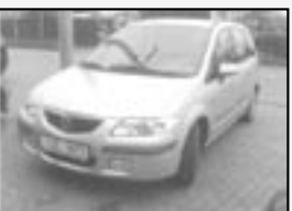
Mazda Premacy 1,8i AT r.v. 1999, cena 145.000 Kč tach.: 132 tis. km, stříbrná metal. klima, 4x airbag, ABS, imob., el. okna a zrc., posíl., mlhovky, palubní PC