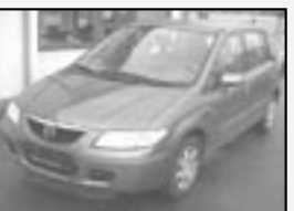
Mazda Premacy 1,8i r.v. 1999, cena 159.000 Kč tach.: 148 tis. km, modrá metal. klima, 4x airbag, ABS, orig. rádio, imob., alu kola, el. zrc. a okna, centrála