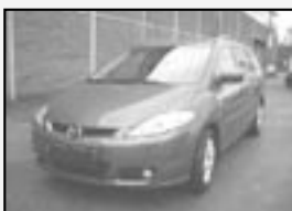
Mazda 5 1,8i N1 (cena bez DPH) r.v. 2007, cena 415.000 Kč tach.: 7,5 tis. km, červená metal. klima, 6x airbag, ABS, ASR, posíl., el. zrc. a okna, imobil., orig. rádio s CD