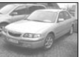
Mazda 626 2,0 GT r.v. 1998, cena 89.000 Kč tach.: 175 tis. km, sv. hnědá metal aut. klima, 4x airbag, ABS, imob., posíl., palub. PC, mlhovky, el. zrc