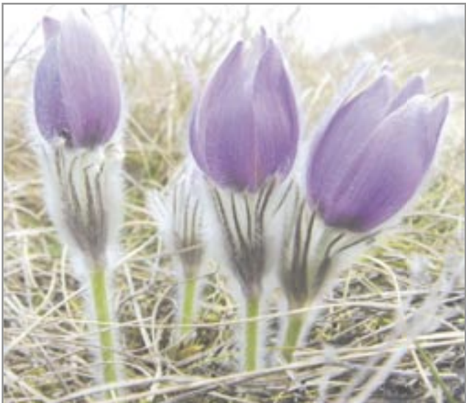
Koniklec obecný je ozdobou výslunných stráni v okolí Dolních Dubňan.

Náhrobní kameny (?) na kostele. U vchodu do kostela se nachází čtyři křížové kameny neznámého stáří. Zřejmě původně sloužily jako náhrobní kameny na hřbitově u kostela. Jako nepotřebné byly použity na zpevnění nároží při opravě kostela. Při poslední rekonstrukci byly objeveny a odkryty. Tři podobné náhrobky jsou také na hřbitovní zdi v Újezdě u Černé Hory.