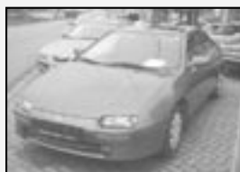
Mazda 323 F 1,5i r.v. 1996, cena 49.000 Kč tach.: 145 tis. km, tm. zelená metal. centrála, el. okna a zrc., posíl., rádio + CD, zadní stěrač