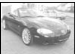
Mazda MX5 1,8i 16V r.v. 2000, cena 269.000 Kč tach.: 76 tis. km, černá metal. 2x airbag, ABS, shr. střecha, alu kola, imob., el. okna a zrc. posíl., tón. skla