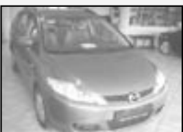
Mazda 5 2,0 MZR r.v. 2006, cena 469.000 Kč tach.: 25 tis. km, tm. šedá metal. aut. klima, 8x airbag, ABS, ASR, el. okna a zrc., alu kola, imob., posíl.