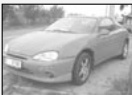
Mazda MX3 1,8i r.v. 1993, cena 54.000 Kč tach.: 190 tis. km, červená ABS, el. okna a zrc., posíl., tón. skla, zadní stěrač, spoiler