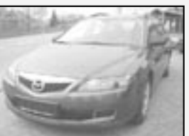
Mazda 6 kombi 1,8i r.v. 2005, cena 388.000 Kč tach.: 86 tis. km, tm. šedá metal klima, 8x airbag, ABS, EDS, posíl., el. okna a zrc., dálk. centrála, orig. rádio