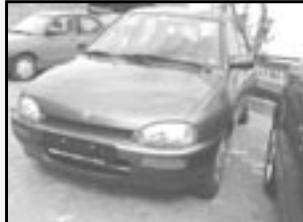
Mazda 121 1,3i DB r.v. 1995, cena 59.000 Kč tach. 48 tis. km, zelená metal. rádio, centrál, tón. skla, manuál, velmi dobrý stav