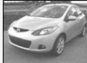
Mazda 2 1,3i r.v. 2007, cena 279.000 Kč tach. 1.000 km, stříbrná metal. 2x airbag, ABS, posil., orig. rádio, imobil., nový vůz