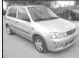
Mazda Demio 1,3i r.v. 2002, cena 165.000 Kč tach. 90 tis. km, stříbrná metal. klíma, 2x airbag, ABS, rádio, imobil., centrál, el. okna, tón. skla, mlhovky