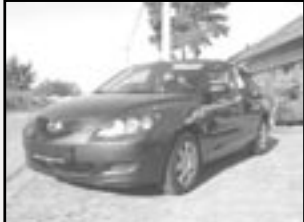
Mazda 3 1,4i SPORT TE r.v. 2007, cena 369.000 Kč tach. 3.500 km, tm. modrá metal. aut. klíma, 8x airbag, ABS, posil., orig. rádio, el. okna a zrc., CD