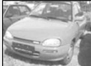
Mazda 121 1,3i DB r.v. 1993, cena 39.000 Kč tach. 125 tis. km, červená centrál, otáček., příprava pro rádio stav dobrý