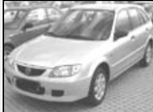
Mazda 323 BJ 1,3i r.v. 2003, cena 215.000 Kč tach. 56 tis. km, stříbrná metal. klíma, 4x airbag, ABS, rádio, el. okna a zrc., imobil., centrál, posil.