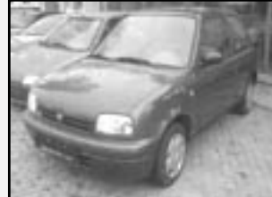
Nissan Micra 0,9i r.v. 1995, cena 59.000 Kč tach. 165 tis. km, tm. zelená metal. airbag řidiče, imobil., otáčekoměr, manuál, nehavarovaný, stav dobrý