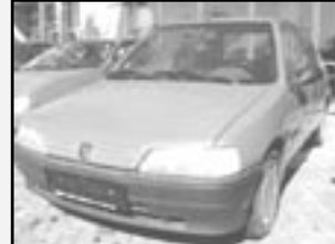
Peugeot 106 1,1i r.v. 1992, cena 34.900 Kč tach. 130 tis. km, červený třídveřový, stav velmi dobrý, nehavarovaný, servisní knížka