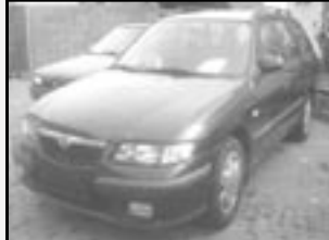
Mazda 626 2,0 DITD kombi r.v. 1998, cena 119.000 Kč tach. 162 tis. km, tm. modrá metal. klíma, 4x airbag, ABS, posil., rádio, centrál, imobil., mlhovky, el. př. okna