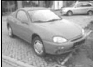
Mazda MX3 1,6i r.v. 1993, cena 59.000 Kč tach. 143 tis. km, červená stav velmi dobrý, nehavarovaná, třídveřová, hatchback