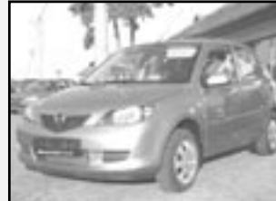
Mazda 2 1,25i r.v. 2007, cena 248.000 Kč tach. 5.500 km, sv. modrá metal. klíma, 4x airbag, ABS, CD, posil., multif. volant, dálk. centrál, rádio