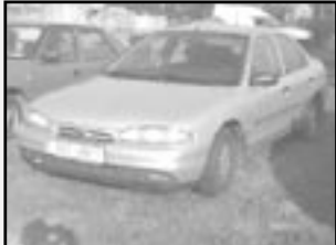
Ford Mondeo 1,8i r.v. 1994, cena 35.000 Kč stříbrná metal. dobrý stav, pětidvéřový komisní prodej

Vyřízení pojistných událostí u smluvních pojišťoven