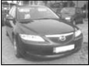
Mazda 6 2,0 MZR CD sedan r.v. 2002, cena 329.000 Kč tach. 88 tis. km, tm. modrá metal. sat. nav., temp., ESP, ASR, EDS, ABS, počítač, 8x airbag, aut. klima, xenony, ...