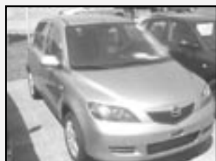
Mazda 2 1,25i r.v. 2007, cena 249.000 Kč tach. 2500 km, světle modrá ABS, posil., otáčk., 4x airbag, orig. rádio, tón. skla, imobil., el. okna