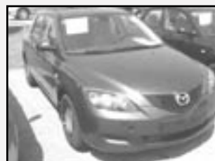
Mazda 3 1,4i SPORT TE r.v. 2007, cena 359.000 Kč tach. 1500 km, tm. modrá metal. aut. klima, ABS, posil., 8x airbag, orig. rádio, el. zrc. a okna, centrální, CD měnič