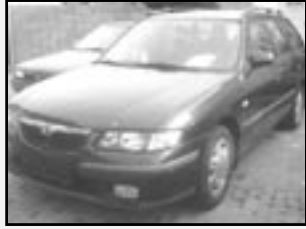
Mazda 626 2,0 DITD kombi r.v. 1998, cena 125.000 Kč tach. 162 tis. km, tm. modrá metal. klima, ABS, posil., 4x airbag, rádio, centrální dálk., imobil. mlhovky, el. zrc.