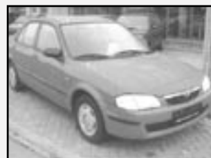
Mazda 323 1,3i BJ sedan r.v. 1999, cena 109.000 Kč tach. 99 tis. km, červená 4x airbag, ABS, rádio, centrální, imobil., el. př. okna, el. zrc., nastav. volant