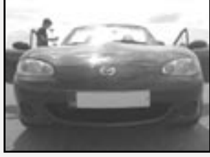
Mazda MX 5 1,6i r.v. 2002, cena 275.000 Kč tach. 45 tis. km, černá metal. ABS, vyhř. zrc., 2x airbag, orig. rádio, centrální, imobil., el. okna, shm. střeška