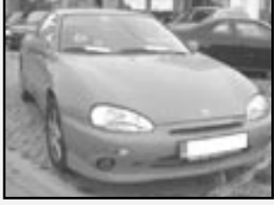
Mazda MX 3 1,8i V6 r.v. 1993, cena 70.000 Kč tach. 160 tis. km, červená ABS, centrální, el. okna, alu kola, nastav. volant, mlhovky, střešní el. šibr, el. zrc.