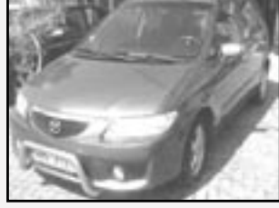
Mazda Premacy 2,0 DITD r.v. 2003, cena 269.000 Kč tach. 84 tis. km, tm. modrá metal. klima, sat. nav., ABS, alu kola, 4x airbag, nastav. volant, rámy, centrální