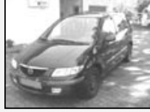
Mazda Premacy 2,0 DITD r.v. 2001, cena 184.000 Kč tach. 120 tis. km, tm. zelená metal. klima, ABS, posil., 4x airbag, orig. rádio, imobil., tón. skla, el. okna, centrální dálk.