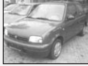
Nissan Micra 0,9i r.v. 1995, cena 59.000 Kč tach. 165 tis. km, tmavě zel. metal benzín, stav dobrý, nehavar., servisní knížka, otáčk., airbag řidiče, imobil.

PLNĚNÍ KLIMATIZACÍ VŠECH ZNAČEK VOZŮ AUTOMATICKÝM PLNÍCÍM ZAŘÍZENÍM ČIŠTĚNÍ NÁPLNÍ