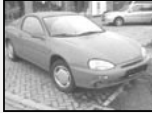
Mazda MX 3 1,6i r.v. 1993, cena 59.000 Kč tach. 143 tis. km, červená 66 kW, benzín, stav velmi dobrý, nehavarované, servisní knížka