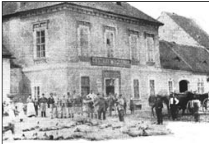
Unikátní snímek asi z roku 1890, z doby, kdy se vepřový dobytek (bagouni) honil mezi městy „po vlastních“ nohách na trhy. Odpočívající prasata před obchodem (přízemní dům) vedle Obecního hostince. Dnes zde stojí zdravotní středisko.

NA VAŠI NÁVŠTĚVU SE TĚŠÍ TEAM HOTELU VINUM COELI.