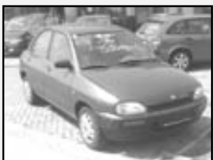
Mazda 121 1,3i r.v. 1994, cena 65.000 Kč tach. 125 tis. km, tm. modrá metal. rádio, imobil., posil., dělená zadní sedadla, perfektní stav

Vyřízení pojistných událostí u smluvních pojišťoven