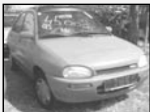
Mazda 121 DB 1,3i r.v. 1993, cena 39.000 Kč tach. 125 tis. km, červená dobrý stav, nehavarované, centrální otáč., příprava pro dádio