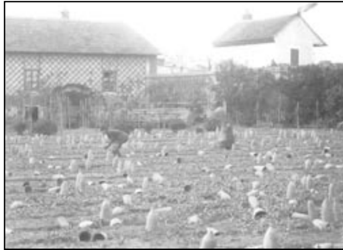
Chřestovna v Chřestové ulici v Ivančicích

v roce 1849 se stal poštmistrem. O rok později byl zvolen starostou města. Za zásluhy o rozvoj Ivančic byl vyznamenán císařem zlatým křížem s korunou. Pocházel z Moravského Krumlova. Odtud měl znalosti o pěstování chřestu. Díky nim sklízeli nejvyšší chřest, který dodávali na císařský dvůr.