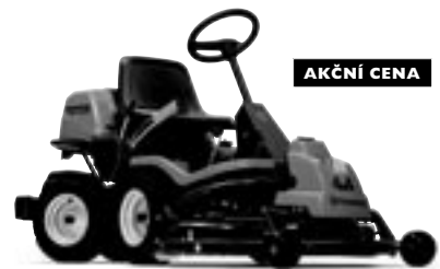
HUSQVARNA RIDER 155 AWD

Ze všech riderů Husqvarna se tento vyznačuje jedinečnou manévrovatelností a dosahem díky pohonu AWD (náhon na všechna kola). Pracuje s rozmanitým příslušenstvím. Kohler 15 hp - šířka sekání 103/112 cm.