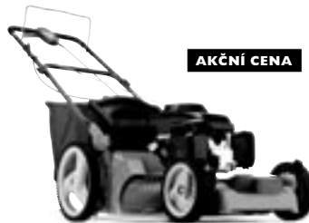
HUSQVARNA R 53SV W

Sekačka s pojezdem s ocelovým žací ústrojem, velkými koly a mimořádně objemným sběrným košem. Nabízí rovněž funkci BioClip (mulčování) a boční výhoz. 5,5 hp - šířka sekání 53 cm.