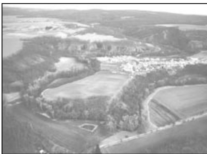
Celkový pohled na hradiště (Čizmář M., Encyklopedie hradišť, 2004)

Hradiště bylo zřejmě přístupné od jihu, v místech dnešní silnice do obce. Další cesta vedla příkopem od severovýchodu mezi Malými Hradisky a Velkým Hradiskem. Třetí přístup, spíše jen