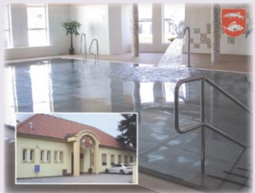
Bazén v Hrušovanech nad Jevišovkou

OBLAST OBCHODU A SLUŽEB provozování sportovních zařízení