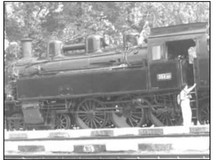
Lokomotiva lidově zvaná „Všudybylka“ na nádraží v Zastávce

a nakláníl pod prudkými nárazy větru, tak že jsme každou chvíli očekávali nějakou katastrofu. Ale i když byla hlášena stanice Brno, nebyl cestující ještě u cíle. Vlak jej vyklopil daleko od vnitřního města, až za starým Brnem, kde je dnes stanice Horní Heršpice na trati Brno-Břeclav. Kdo chtěl pokračovat do Brna, případně měl zavazadla mohl použít „konfortáblu“, kočárku taženou jedním koníkem, který pohodlných klusem potřeboval skoro půl hodiny, než dospěl k hlavnímu brněnskému nádraží“. Pro informaci čtenářů uvádíme, že vagónu se říkalo „Imperial“ (nevíme proč) nebo podle zabarvení „Papoušek“.