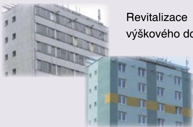
Revitalizace výškového domu