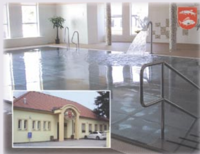
Bazén v Hrušovanech nad Jevišovkou