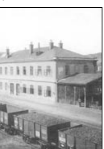
Stavba v Zastávce u Brna v 80. letech 19. století. kopie pohlednice z Archivu Vlastivědného spolku Rosicko-Oslavanska

že se jednotlivé oddíly podle třídy odlišovaly barevným nátěrem vnějších stěn: I. třída kamárkovou žlutí, II. třída světlou zelení a III. třída rudohnědou. Rozdělování podle pohlaví bylo dodržováno velmi přísně. Když jsem jednou jel jako devítiletý hoch s matkou, musil jsem do poschodí, kdežto má matka proti tomu protestující zůstala v „přízemí“. A vystál jsem tehdy plno strachu. Cestou nás překvapila bouře. Liják s rachotem bubnoval na jednoduchou plechovou střechu, vůz se chvěl