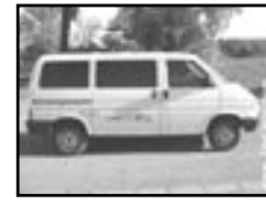
VW Transporter 1.9D - 8 míst r.v. 1992, cena 115.000 Kč stav velmi dobrý, ZIMNÍ PNEU, koupeno v D, 1. majitel, rádio, střešní okno, posil., tažné