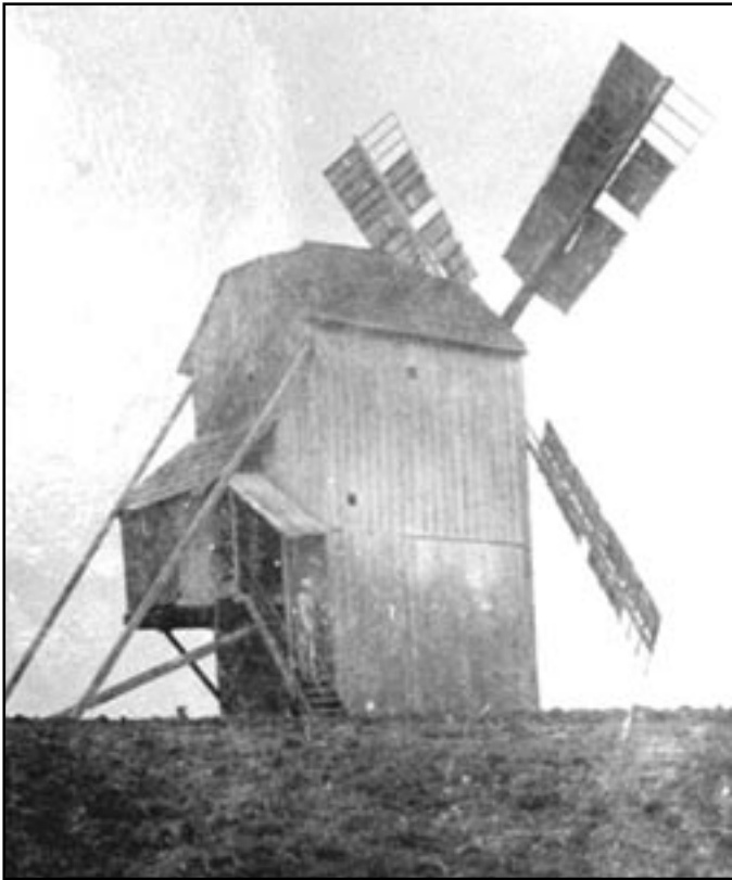
Dřevěný větrný mlýn v Sivicích nedaleko Brna. Stejný pravděpodobně stával na kopci Větrníku v Miroslavi.

Mletí obilí na mouku je prastará činnost. Jednoduché pomůcky k drcení obilných zrn se u nás objevily již v mladší době kamenné s příchodem prvních zemědělců do naší krajiny.