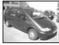
Ford Galaxy 1.9 TDI r.v. 1999, cena 209.000 Kč nové rozvody + olej + brzdý. 5 sedadel., 2x airbag, ABS, imobil., alarm, posil., centrální dálkový