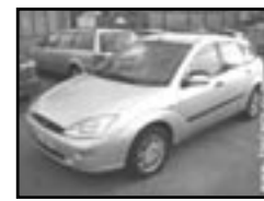
Ford Focus 2.0i GHIA r.v. 1999, cena 159.000 Kč klima, 2x airbag, ABS, originální rádio, posil., alu kola, tažné, centrální dálkový, otáčk., el. zrcátka