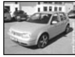
VW Golf 1.9 TDI r.v. 2000, cena 242.000 Kč klima, 4x airbag, ESP, ABS, CD, imobilizér, el. okna, posil., poč., alu kola, centrální dálk., tón. skla