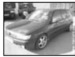
Peugeot 306 1.6i r.v. 1996, cena 65.000 Kč airbag řidiče, orig. rádio, el. okna, stř. šibr el., posil., alu kola, centrální dálk., otáčk., el. zrcátka