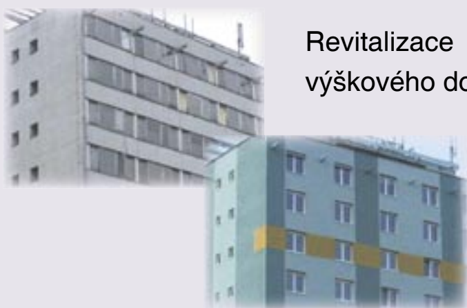
Revitalizace výškového domu