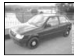
Ford Fiesta 1.1i r.v. 1993, cena 29.900 Kč 5 míst, tmavě modrá, obsah 1 119 ccm, 37 kW, benzín, stav dobrý, + 4 zimní pneu, rádio