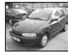
Fiat Palio 1.3 combi r.v. 1998, cena 99.000 Kč stav velmi dobrý, klimatizace, centrální, imobil., el. okna, stř. šibr el., posil., alu kola, tažné, otáčkoměr, mlhovsky