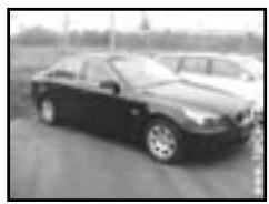
BMW 530 D r.v. 2004, cena 860.000 Kč manuál, sat. nav., 6x airbag, ABS, xenony, el. okna, posil., poč., multif. volant, alu kola, centrální dálk.