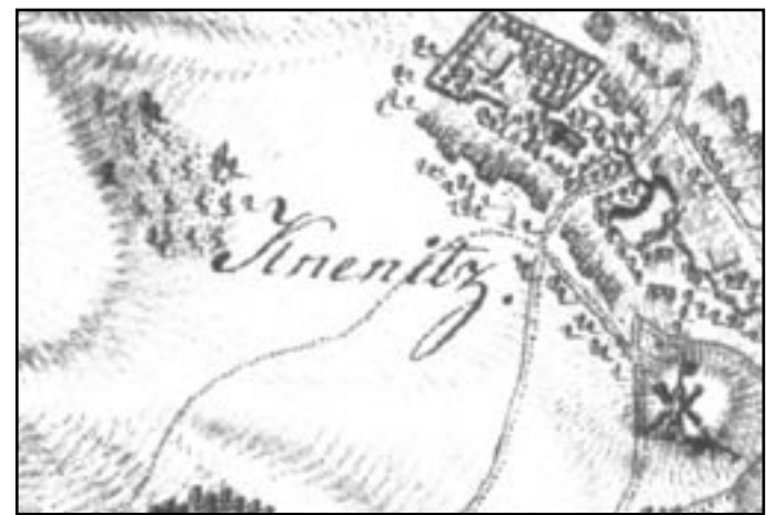
Miroslavské Knínice kolem roku 1780 (mapa I. vojenského mapování). Větrník je vidět na jižním okraji obce.

Také Knínice měly svůj větrný mlýn. Nacházel se na návrší nad obcí, v dnešní místní části „Na Větrníku“. Místní jméno je v současnosti jedi-