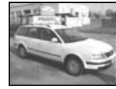
VW Passat Variant 1.9 TDI r.v. 2000, cena 189.000 Kč klima, 4x airbag, ESP, ABS, CD, imobil., el. okna, posil., poč., centrální dálk., tón. skla, vyhř. el. zrc., mlhovsky