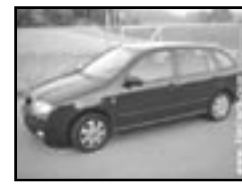
Škoda Fabia combi 1.4i r.v. 2001, cena 159.000 Kč plyn + benzín, 4 bodový vstřík LPG, airbag řidiče, rádio, centrální, imobil., el. př. okna, tažné, tón. skla