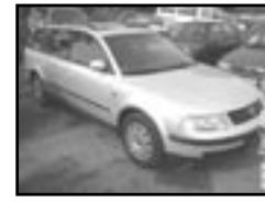
VW Passat Variant 1.8 r.v. 1998, cena 165.000 Kč 4x airbag, ABS, rádio, centrální, el. př. okna, stř. šibr el., a nosič, posil., tažné, tón. skla, vyhř. zrc.