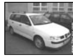
Seat Cordoba Vario 1.9 SDI r.v. 1999, cena 95.000 Kč stav dobrý, servisní knížka, 4x airbag, orig. rádio, imobilizér, el. okna, posilovač