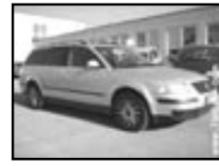
VW Passat Variant TDI B6 r.v. 2001, cena 265.000 Kč aut. klima, 2x airbag, ABS, šibr el., posil., centrální dálkový, tón. skla, otáčkoměr, vyhř. el. zrc.