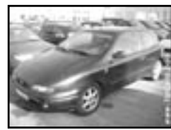
Fiat Bravo 1.9 TD 100 r.v. 1997, cena 69.000 Kč NOVÉ ROZVODY., koupeno v I, klima, el. okna, posil., alu kola, centrální dálk., otáčkoměr