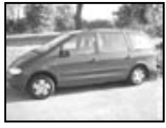
Ford Galaxy 1.9 TDI r.v. 1996, cena 159.000 Kč 3 SEDADLA, ČIP NA 115 PS, po servis., klima, 2x airbag, ABS, el. okna, posil., tažné, el. zrc.