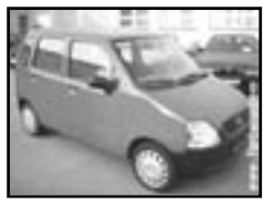
Opel Agila r.v. 2002, cena 139.000 Kč stav velmi dobrý, nehavar. servisní knížka, 4x airbag, ABS, originální autorádio, posil., el. zrcátka