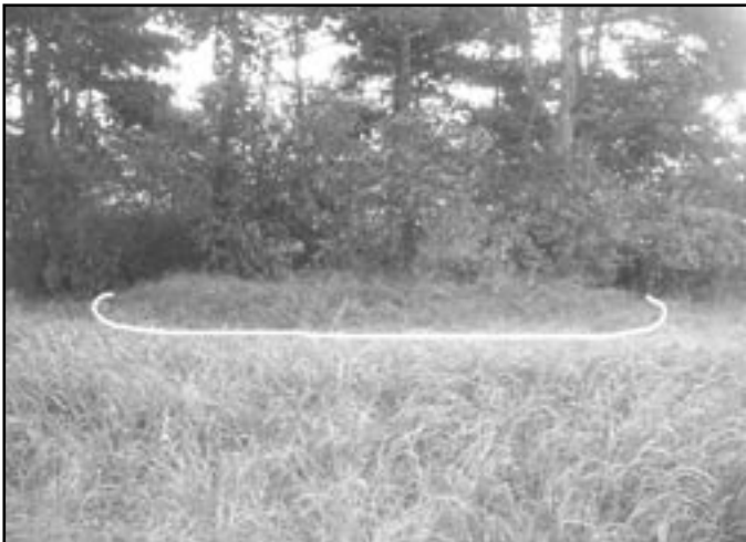
Větrník v Miroslavi. Dnes je zde patrný jen podstavec dřevěného mlýna.

V našich zemích se využití síly větru k mletí rozšířilo již