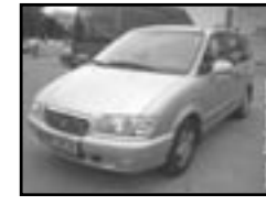
Hyundai Trajet 2.0i 7 míst r.v. 2001, cena 215.000 Kč cena bez DPH, klima, 2x airbag, ABS, rádio, el. okna, posil., tažné, centrální dálk., tón. skla, el. zrc.