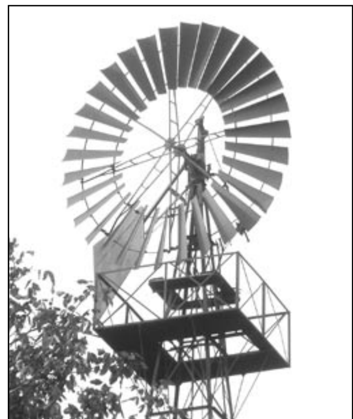
„Větrné kolo“ ve Vedrovicích