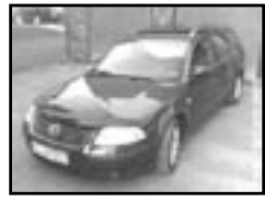
VW Passat Variant 1.9 TDI r.v. 2003, cena 339.000 Kč 4x airbag, ABS, el. okna, posil., poč., alu kola, vyhř. sed., tažné, centrální dálk., el. zrc., temp., mlhovsky