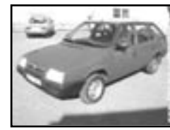
Škoda Forman 135 LX r.v. 1993, cena 44.000 Kč benzín, úvěr, rádio, střešní okno, tažné zařízení