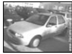
Ford Fiesta 1.2 ZETEC r.v. 1997, cena 78.000 Kč klima, 2x airbag, originální rádio, el. okna, posil., centrální dálk., tón. skla, otáčkoměr, el. zrcátka