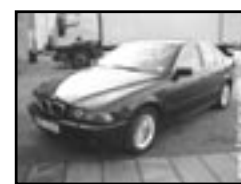
BMW 530 D r.v. 2000, cena 299.000 Kč aut. klima, 4x airbag, xenony, ABS, okna, poč., multif. volant, alu kola, tažné, centrální dálk., temp.