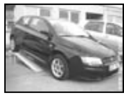
Fiat Stilo 1.9 JTD r.v. 2002, cena 184.000 Kč aut. klima, 6x airbag, ASR, ABS, imobil. el. okna, poč., alu kola, centrální dálk., vyhř. el. zrc., temp.