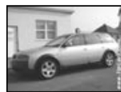
Audi Allroad 2.5 TDI r.v. 2001, cena 529.000 Kč aut. klima, 8x airbag, xenony, ESP, ABS, CD, alar. alar. el. výbava, poč., 4x4, alu kola