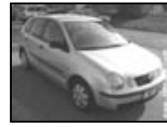
VW Polo 1.2 HTP r.v. 2003, cena 169.000 Kč 2x airbag, originální autorádio, imobilizér, alarm, posil., centrální dálkový, tónovaná skla