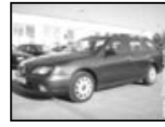
Nissan Primera r.v. 2001, cena 187.000 Kč klima, 2x airbag, ABS, imobil., el. okna, posil., poč., multif. volant, stř. nosič, centrální dálk., vyhř. el. zrc.