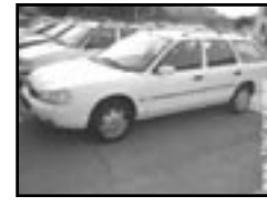
Ford Mondeo COMBI 1.8 16 V r.v. 1997, cena 79.000 Kč klima, 2x airbag, ABS, centrální, el. okna, posil., el. seřid. a vyhř. sed., vyhř. přední sklo, el. zrc.