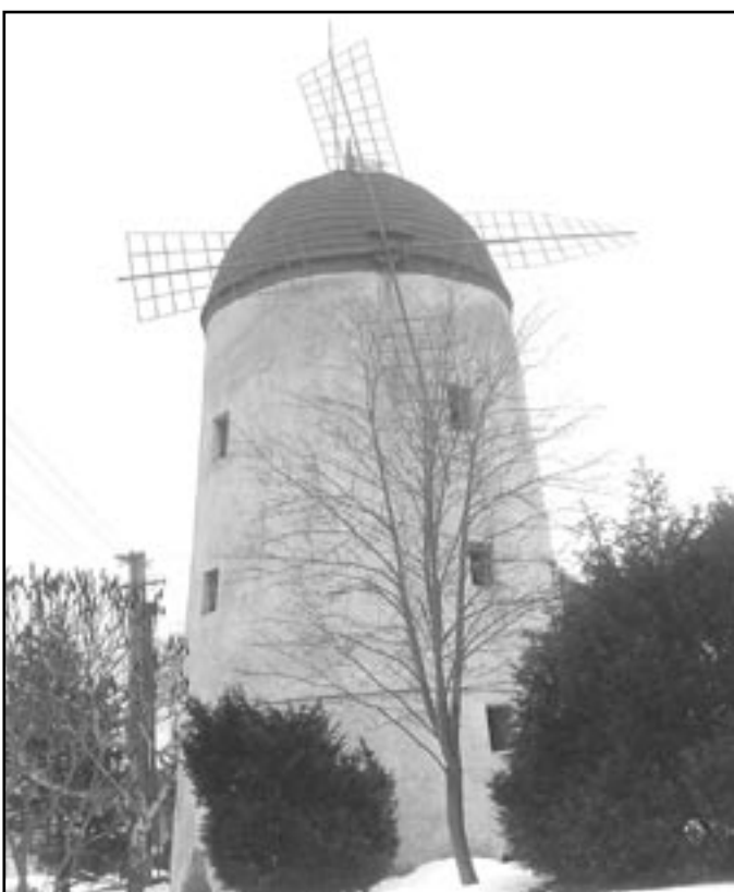
Dosud stojící větrný mlýn v Třebíči - Borovině. Sloužil k mletí smrkové kůry pro koželuhy.

Významnou technickou památkou našeho regionu je „větrné kolo“ ve Vedrovicích, postavené v letech 1912-14. Nejde o větrný mlýn, ale pod-