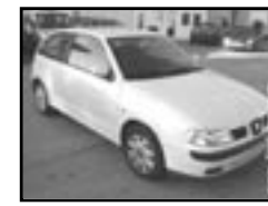
Seat Ibiza 1.4i klimatronic r.v. 2001, cena 145.000 Kč aut. klima, 2x airbag, ABS, alarm, el. př. okna, posil., poč., centrální dálk., tón. skla, vyhř. el. zrc., mlhovsky