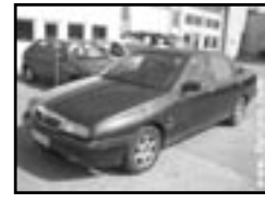
Lancia Kappa 2.4i r.v. 1998, cena 62.000 Kč stav dobrý, klima, 2x airbag, ABS, rádio, el. okna, alu kola, centrální dálk., otáčk., el. zrcátka