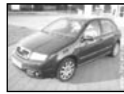
Škoda Fabia 1.9 TDI RS r.v. 2004, cena 319.000 Kč klima, 4x airbag, xenony, ASR, ABS, CD, poč., alu kola, sport. sed., centrální dálk., vyhř. el. zrc., mlhovsky