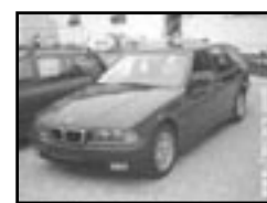
BMW 316 touring r.v. 1997, cena 149.000 Kč klima, 2x airbag, centrální, imobil., stř. šibr el., posil., alu kola, tón. skla, el. zrc., mlhovsky