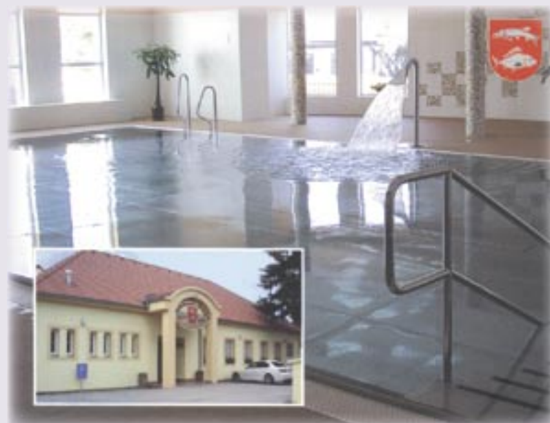
Bazén v Hrušovanech nad Jevišovkou