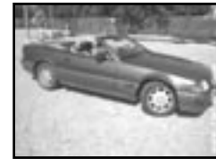
Mercedes-Benz SL 320 HARDTOP r.v. 1996, cena 399.000 Kč aut. klima a přev., 2x airbag, ASR, ABS, kúže, CD, alar. alar. el. př. okna, alu kola, centrální dálk., tempomat