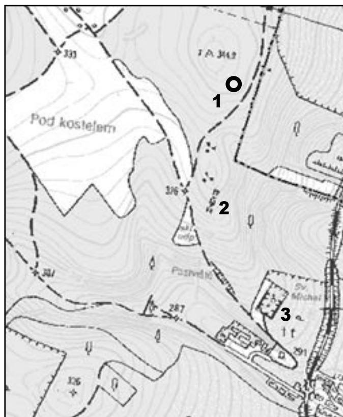
Mapka okolí Bohutic - 1) zbytek větrníku, 2) ruina domu novokřtěnců, 3) bohutický hřbitov