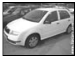
Škoda Fabia 1.4i r.v. 2002, cena 155.000 Kč stav velmi dobrý, nehavarované, servisní knížka, airbag řidiče, rádio, imobilizér, posil., otáčkoměr