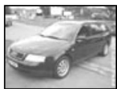
Audi A6 2.5 TDI 180 PS r.v. 2001, cena 335.000 Kč aut. klima, sat. nav., aut. přev., 6x airbag, xenony, ESP, ABS, max el. výbava, posil., poč., alu kola

telefon a fax: 546 452 948 mobil: 602 526 745 606 385 292, 602 536 741 e-mail: avtom@volny.cz www.avautobazar.cz