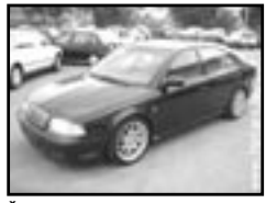
Škoda Octavia 1.6i r.v. 1998, cena 159.000 Kč klima, 2x airbag, ABS, centrální, imobil., el. okna, posil., alu kola, tón. skla, vyhř. el. zrcátka, spoiler