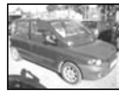
Fiat Multipla 1.9 JTD r.v. 1999, cena 129.000 Kč klima, 2x airbag, ABS, centrální, el. okna, stř. šibr el., posil., alu kola, indikátor park., tón. skla, mlhovsky